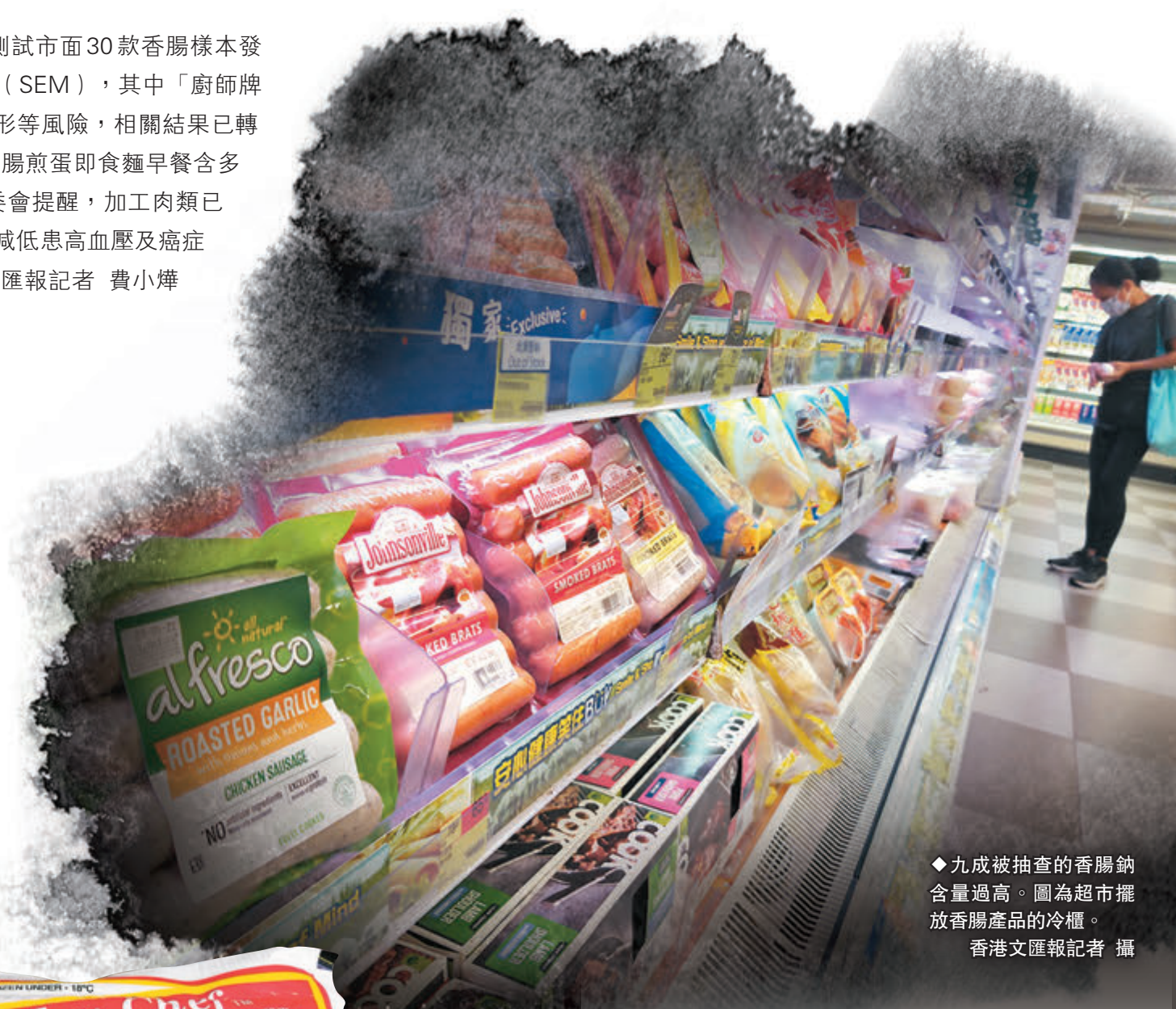
◆九成被抽查的香腸鈉含量過高。圖為超市擺放香腸產品的冷櫃。

連同以上個案，基金於過去10年共有11宗個案最終達成和解，涉及金額逾224萬元，當中以涉及美容及健身相關的個案佔5宗最多。一名有精神病的受助人即使已表明對涉案美容院推銷之會員計劃不感興趣，美容院仍安排受助人於狹小房間內由兩名職員作出長達一小時的高壓推銷，言談間使他感到「必須購買計劃才可離開」及「不好意思不購買」的心理壓力，最終先後購買3份類似的會員計劃及2份美容套餐。基金認為個案涉及不良營商手法及不合情理行為，決定向商戶提出申索，美容院終退回276,000元作和解。