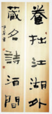
◆老墨拙書對聯「養拙江湖外，藏名詩酒間」。

古拙，首先呈現的是天然蒼勁。山水畫中，無枯木不能出蒼古之態。東方人尤其能領會枯槁之美，蒼老之趣。衛夫人的學書秘籍《筆陣圖》是講寫字筆法的書法論著，其中這樣寫道：