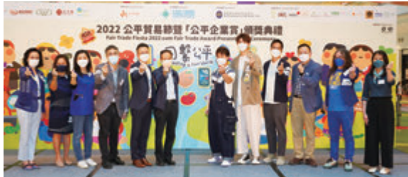
2022公平貿易節舉辦，連結良心商家與消費者，同繫公平。

今年的公平貿易節以「同繫公平」為主題。透過連繫公平貿易商家和消費者，希望讓公眾知道，公平貿易不單提倡貿易活動的公平性，它亦扣連着環保、良心消費和可持續發展等十分貼近大眾生活的課題。透過支持良心商家和產品，既推動國際貿易更符公義、公平和公