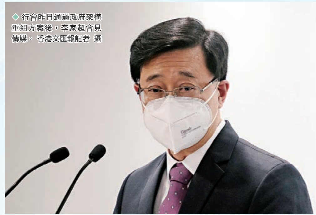
◆行會昨日通過政府架構重組方案後，李家超會見傳媒。