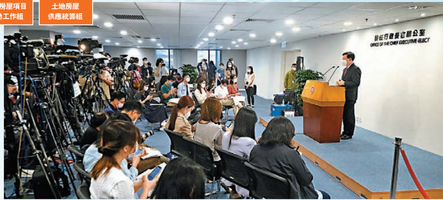
◆李家超昨日會見傳媒時，介紹政府架構重組方案，包括增設三名副司長職位的建議。

特區政府昨日宣布，行政會議昨日通過重組香港特區政府架構的建議方案，以期於7月1日起實行。方案包括現任行政長官於去年10月發表的2021年施政報告中提出並於今年1月向立法會詳細介紹的多項建議，包括成立新的文化體育及旅遊局；分拆運輸及房屋局為兩個政策局，即運輸及物流和房屋局；創新及科技局改名為創新科技及工業局；重組民政事務總局為民政及青年事務總局；擴大環境局並改名為環境及生態局；改組食物及衛生局為醫務衛生局等。這些建議，均獲李家超全盤接納。