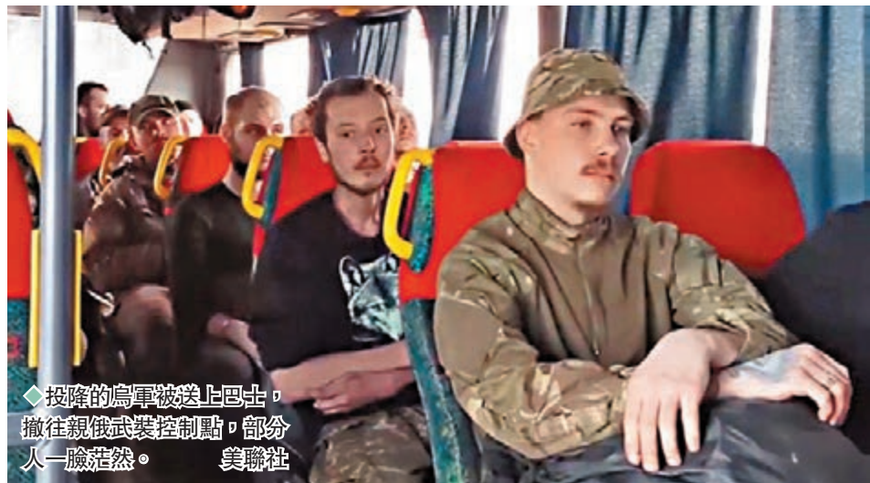
◆投降的烏軍被送上巴士，撤往親俄武裝控制點，部分人一臉茫然。

經歷長達82天的戰鬥，死守馬里烏波爾亞速鋼鐵廠的烏克蘭守軍，前日終於向俄軍投降，首批共264名士兵已撤往親俄武裝控制點，烏克蘭同時宣布完成在馬里烏波爾的「戰鬥任務」，將馬里烏波爾的控制權移交俄羅斯，標誌着這場俄烏衝突「最漫長戰役」終於結束。烏克蘭表示，將尋求以交換戰俘方式帶回這批守軍，克里姆林宮則表示，俄總統普京已經保證將會按國際標準對待投降將士。