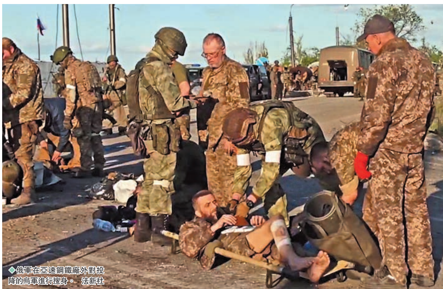
◆俄軍在亞速鋼鐵廠外對投降的烏軍進行搜身。

經歷長達82天的戰鬥，死守馬里烏波爾亞速鋼鐵廠的烏克蘭守軍，前日終於向俄軍投降，首批共264名士兵已撤往親俄武裝控制點，烏克蘭同時宣布完成在馬里烏波爾的「戰鬥任務」，將馬里烏波爾的控制權移交俄羅斯，標誌着這場俄烏衝突「最漫長戰役」終於結束。烏克蘭表示，將尋求以交換戰俘方式帶回這批守軍，克里姆林宮則表示，俄總統普京已經保證將會按國際標準對待投降將士。