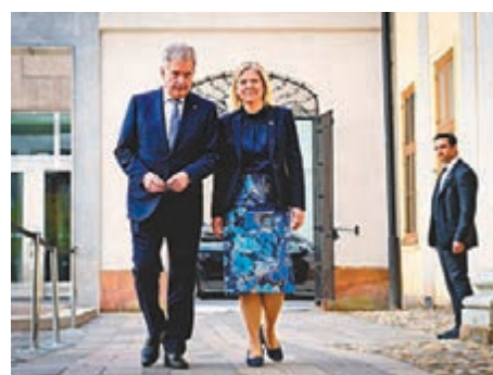
◆芬蘭總統尼赫托(左)及瑞典首相安德松明日到訪華盛頓。