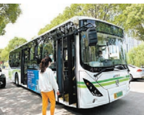
截至5月18日，上海已有17條公交線恢復運營。