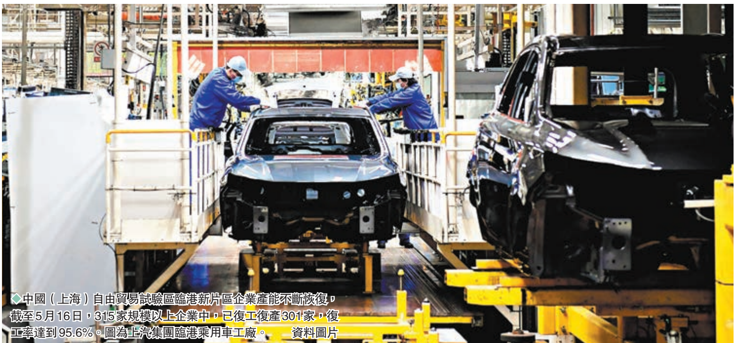
中國（上海）自由貿易試驗區臨港新片區企業產能不斷恢復，截至5月16日，315家規模以上企業中，已復工復產301家，復工率達到95.6%。圖為上汽集團臨港乘用車工廠。

柳波表示，集成電路、汽車製造、生物醫藥等一直是上海的重點產業，也是今後外貿保穩提質的戰略支撐。上海海關將通過做大「綠色通道」、優化監管模式、採取臨時性監管措施，支持產業鏈穩鏈補鏈強鏈，推動重點產業盡快復產。