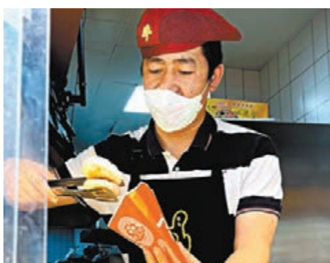
剛出鍋的牛肉煎包，帶著熱氣，也帶來了城市的煙火氣。