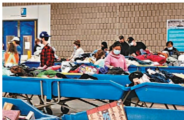
◆平價銷貨場出售的物品不上架，只把收回來的物品放在攤位。