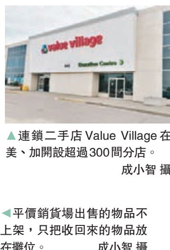
◆連鎖二手店Value Village在美、加開設超過300間分店。