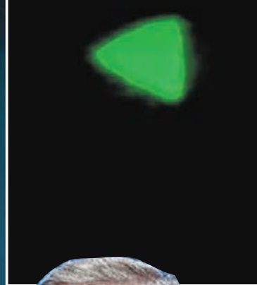
◆兩個金字塔形狀的小物體，不斷閃爍着從一架飛機的駕駛艙邊飛過。