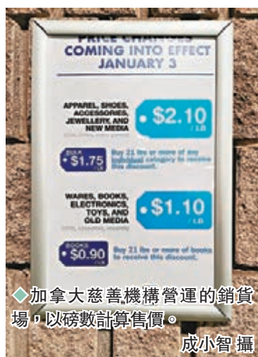
◆加拿大慈善機構營運的銷貨場，以磅數計算售價。