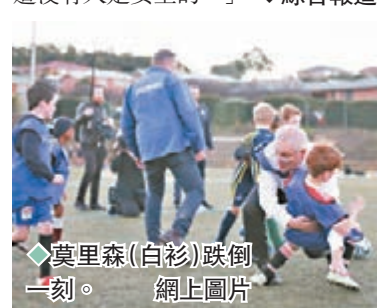
◆莫里森(白衫)跌倒一刻。

諷刺的是，莫里森上周曾自稱是一台推土機，以示他一旦連任會改變施政模式，在野黨國會議員萊爾便在网上調侃道：「在推土機周遭沒有人是安全的。」