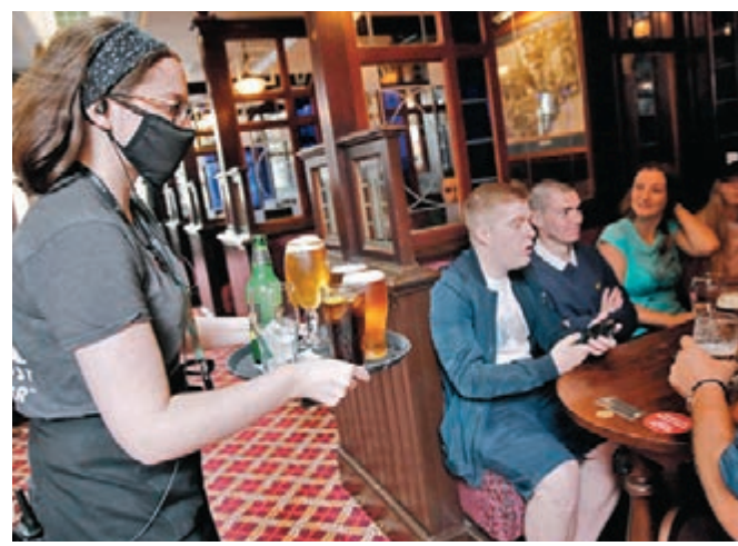
◆英國兩大連鎖酒吧集團警告，龐大成本壓力或會導致業界大幅削減成本。 ◆綜合報道 資料圖片

英國工業聯合會首席經濟學家牛頓-史密斯表示，展望未來，通脹可能維持高位，從而導致家庭收入出現歷史性縮水，企業經營環境也將變得更艱難。政府應探索多種途徑來幫助面臨困難的民眾並支持脆弱企業。