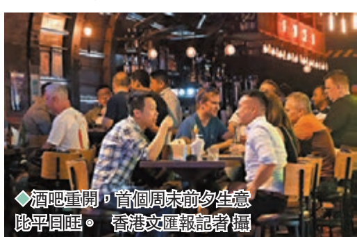
酒吧重開，首個周末前夕生意踴躍。

香港文匯報訊（記者 蕭景源）昨日是酒吧復業後的首個小周末，蘭桂坊大部分酒吧都人頭湧湧，在露天區的數十張枱都坐滿人。據香港文匯報記者現場觀察，大部分顧客都自覺遵守防疫規