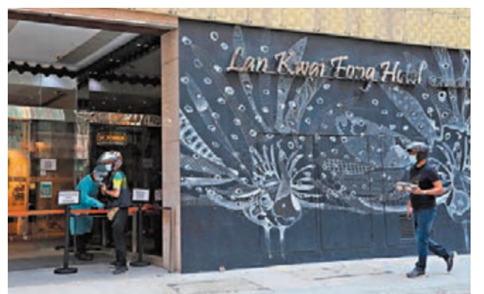
外賣員為中環蘭桂坊酒店的檢疫住客送餐。

他相信出現酒店內傳播不外乎酒店硬件欠佳或行政疏忽，「明白酒店員工的工作壓力大，但如管理不好，會出現大型爆發風險。」對於特區未有公布指定檢疫酒店內的傳播個案數字，他認為應提高資訊透明度，讓市民清晰知道哪些酒店曾經爆發及其個案數目等詳情，「這樣除了令市民更安心，也可鞭策酒店做得更好，有利吸客。」