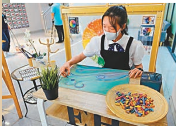
◆東莞暨大港澳子弟學校營造多元化校園氛圍。圖為一名學生在畫畫。