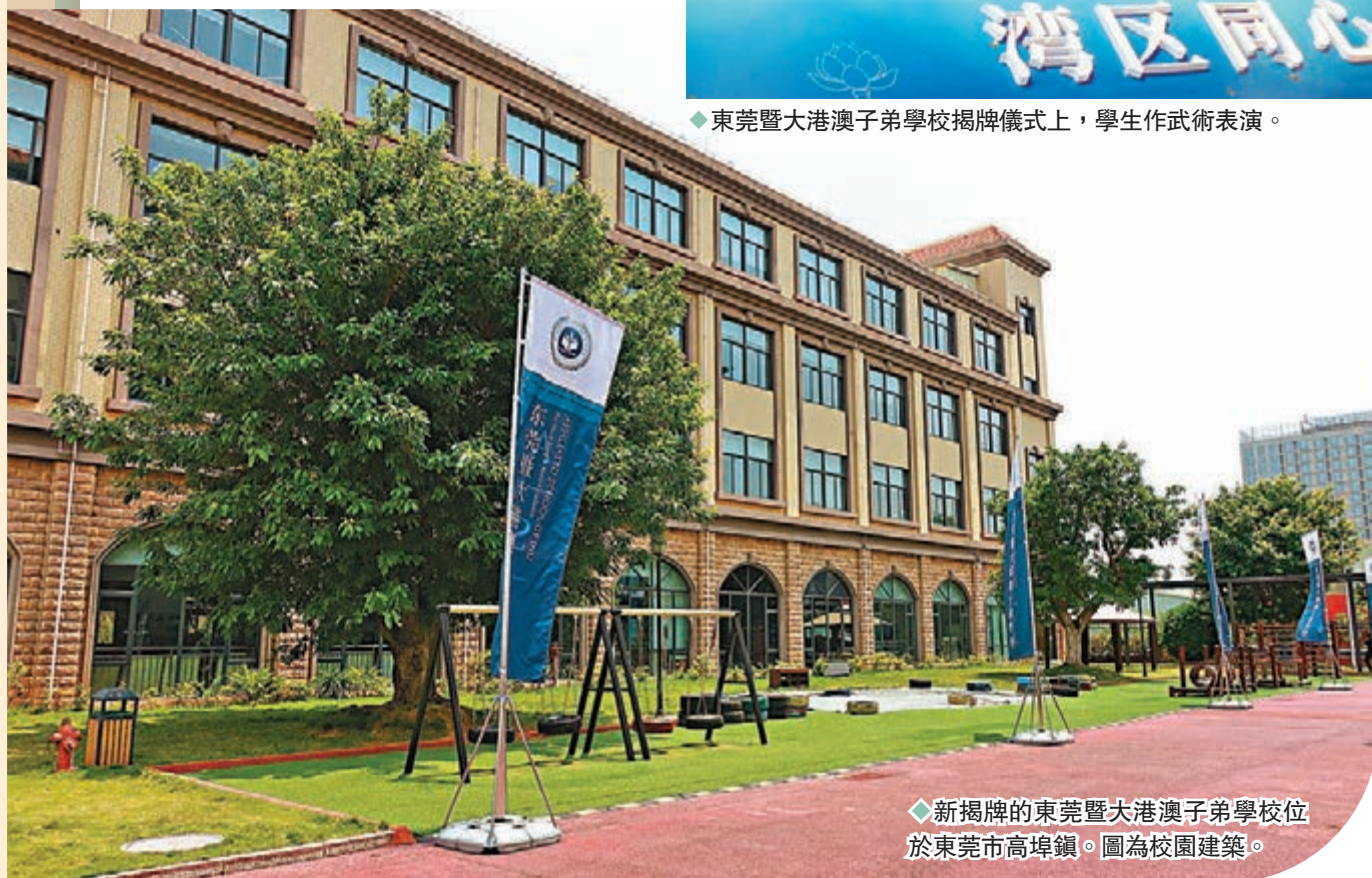
◆新揭牌的東莞暨大港澳子弟學校位於東莞市高埗鎮。圖為校園建築。

隨着粵港澳大灣區發展，北上大灣區內地城市發展的港人越來越多。東莞暨大港澳子弟學校是由東莞伊頓教育集團與暨南大學、香港維港教育集團三方創辦。在揭牌儀式上，廣東省教育廳一級巡視員、副廳長朱超華表示，廣東省教育廳和香港教育局、澳門教育及青年發展局通力合作，支持符合條件的舉辦者設立港澳子弟學校。他說，港澳子弟學校會在符合國家有關政策的前提下，使用與港澳中小學基本一致的學制、教學內容和教學方式，聘用港澳師資，探索三地基礎教育融合發展的新模式。而東莞暨大港澳子弟學校的成立，將為定居粵港澳大灣區居民子女提供更多就讀選擇，培養符合大灣區發展需要的新生力量。