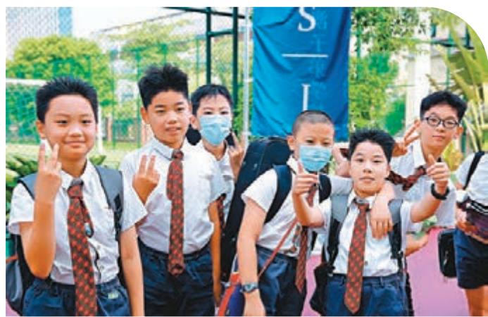
◆幾名學生在鏡頭前開心合影。