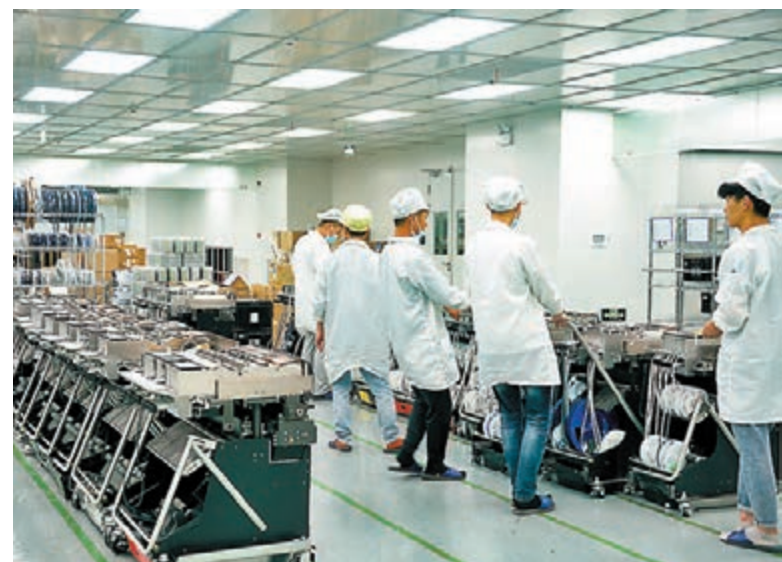
◆台資東碩電子（昆山）員工正在工作。資料圖片