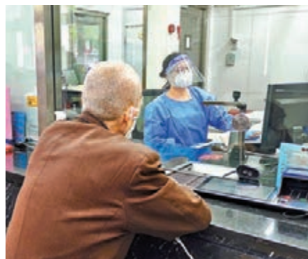
◆上海居民到銀行轉存工資，銀行員工需身著防護服裝為顧客服務。

余文建日前介紹，據不完全統計，自3月份以來，上海市各金融機構共向731家抗疫物資保供企業、物流企業發放貸款335億元（人民幣，下同），其中80%為信用貸款，向餐飲零售、旅遊運輸等受疫情影響的1萬多家企業發放貸款723億元。