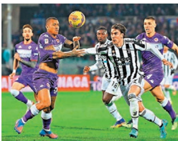
◆費倫天拿(紫衫)誓要在祖雲達斯身上搶分。法新社

另一方面，祖雲達斯高層近日據報和曼聯的保羅普巴會面，商討該名今夏約滿的法國中場能否重返「斑馬兵團」；據報「祖記」願意開出750萬歐元年薪加獎金的條件，法甲班霸巴黎聖日耳門則是其最大競爭對手。