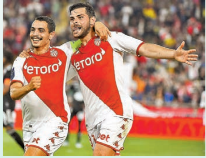
◆摩納哥近況無可挑剔。

機會最高的摩納哥今晚將作客朗斯（now714台周日3：00a.m.直播）。摩納之前其實一直只在中上游徘徊，但3月歐霸出局後突然醒覺，至今在聯賽累積9連勝，手下敗將還包括巴黎