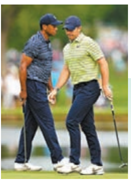
▶麥萊爾(右)首日表現遠較活士出色。

高爾夫球四大滿貫賽事之一的PGA錦標賽，昨日在美國奧克拉荷馬州展開，結果北愛爾蘭球手麥萊爾打出低標準5桿的65桿，1桿領先東道主美國球手賀治和沙拉托利斯暫列榜首。至於深受球迷喜愛的「老虎」活士是日表現平平，僅打出高標準4桿的74桿，和多位球手並列第99位。 ◆綜合外電