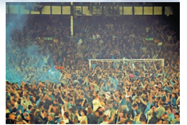
◆愛華頓球迷賽後全湧入球場慶祝。

迷衝入球場慶祝，球員時代贏過無數錦標的林柏特直言這場勝利是他生涯中最美妙的時刻之一：「球隊上半場落後兩球，不過換邊後展現出強大的鬥心，無論球員或球迷都值得好好享受這精彩一夜。」上任以來一直備受壓力，林柏特表示所有的辛酸來到這一刻都變成值得：「在最近這幾個月我們面對不同的困難和挑戰，在我剛來到時外間對我的期望很大，但我們的努力得不到應有回報，幸好球隊上下均不曾放棄，在堅持不懈下終於修成正果。」