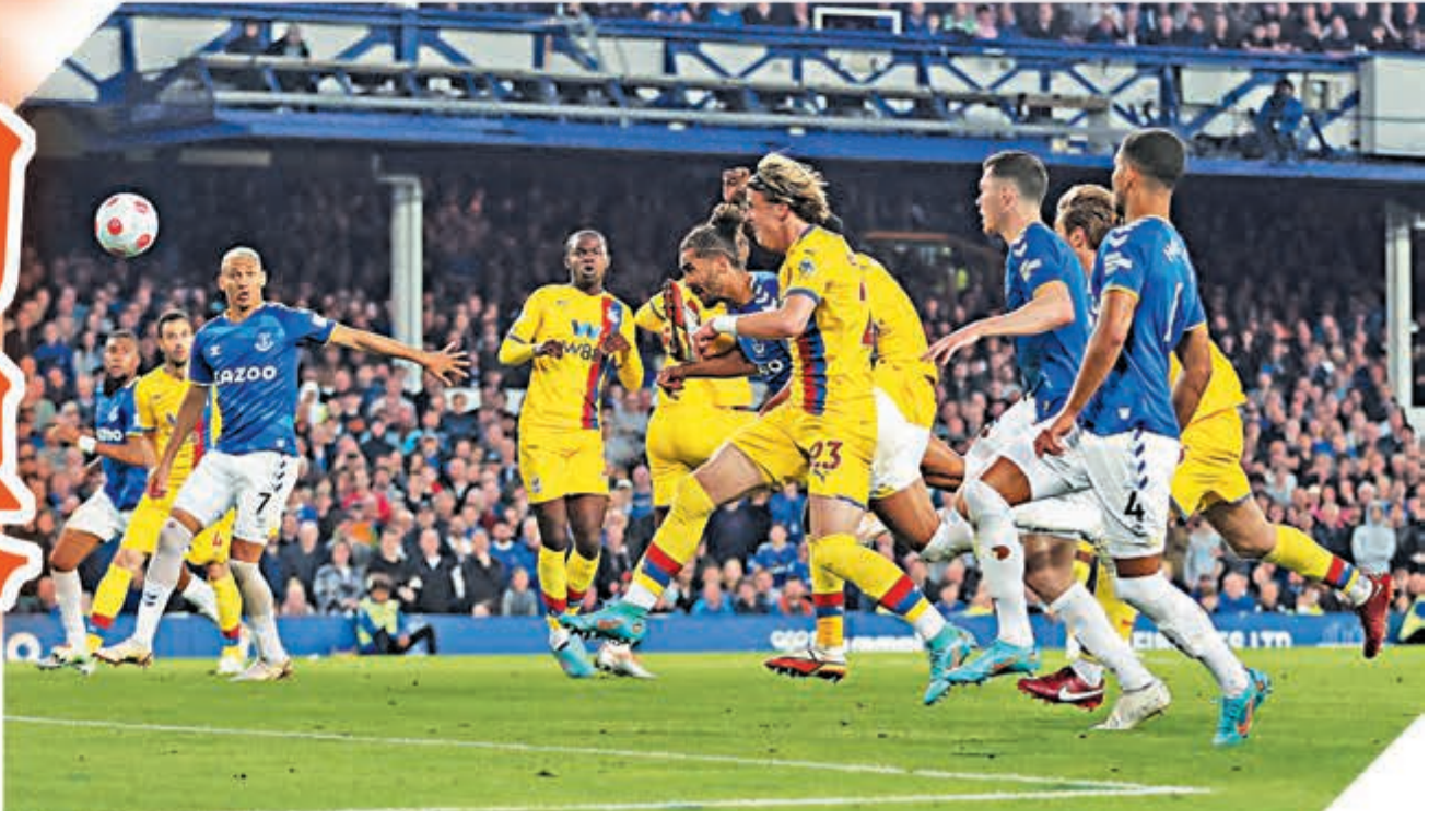
▶卡維特利雲助愛華頓奠定勝局。