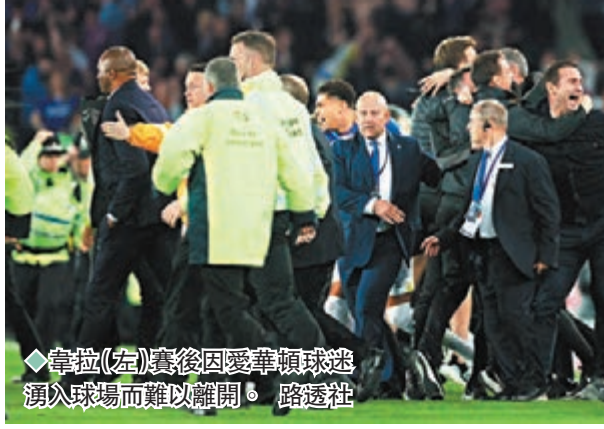
◆韋拉(左)賽後因愛華頓球迷湧入球場而難以離開。

韋拉賽後接受訪問時，難免被問及腳踢球迷一事，但這位法國名宿明顯不願多談，只表示沒有話想說，而英國傳媒則表示韋拉雖是被挑釁，但仍可能面臨判罰。