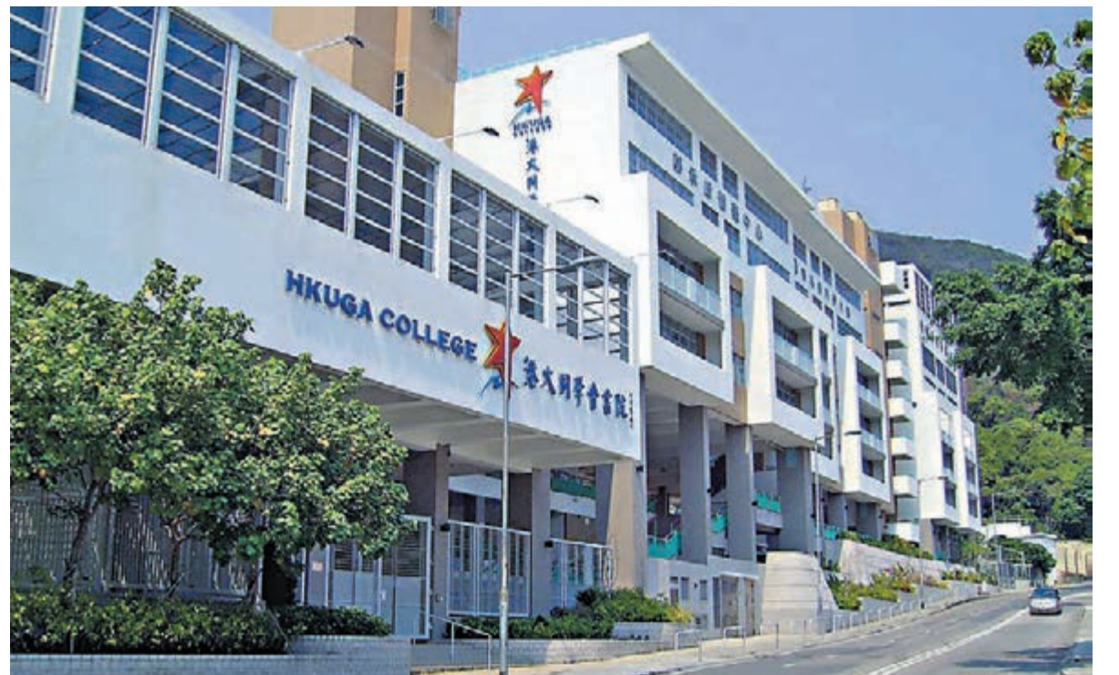
◆黃竹坑港大同學會書院中一年級3名同班男同學確診，3人均只完成接種一劑新冠疫苗，疑堂上短暫除口罩飲水播疫。

西區電訊大廈13樓「Benchmark 宏思」培訓中心昨日則再發現4名學員確診，累計21人染疫，包括19學生、2職員。他們均於本月13日至20日期間發病。