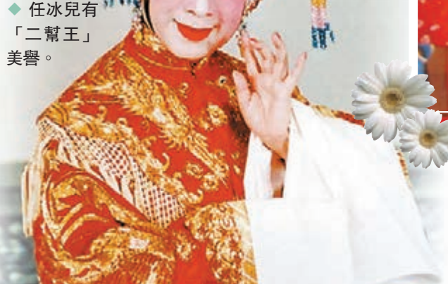
◆任冰兒有「二幫王」美譽。