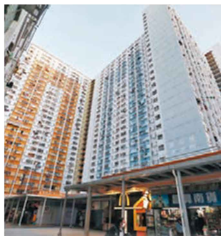
◆坪石邨所在的觀塘區是全港最多空置公屋的區份。資料圖片