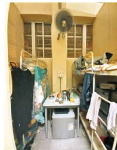
◆臨時收容中心頗為簡陋。

中轉房屋是1970年代港英政府安置區的延伸，當時設立安置區（後稱臨時房屋區），用作安置住在不適切居所（如寮屋、天台、籠屋）的居民。及後因居住環境惡劣（例如多戶共用廁所），政府決定於2000年底前清拆所有安置區，取而代之的是興建中轉房屋作為安置政策下的臨時居所。高峰時期全港先後建有6個中轉房屋項目，全部位於新界，後因使用率偏低，大部分被拆卸。