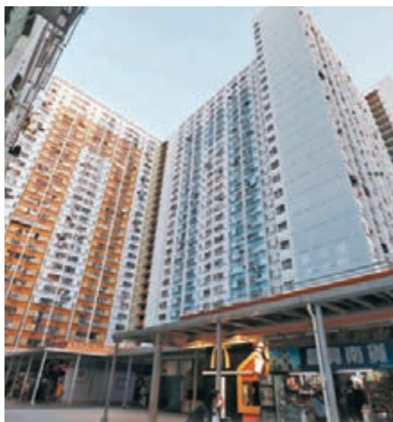
◆坪石邨所在的觀塘區是全港最多空置公屋的區份。