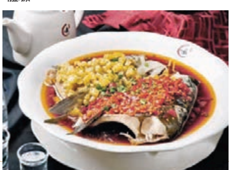
◆鴛鴦魚頭裏的剝椒是經典的湖南滋味。