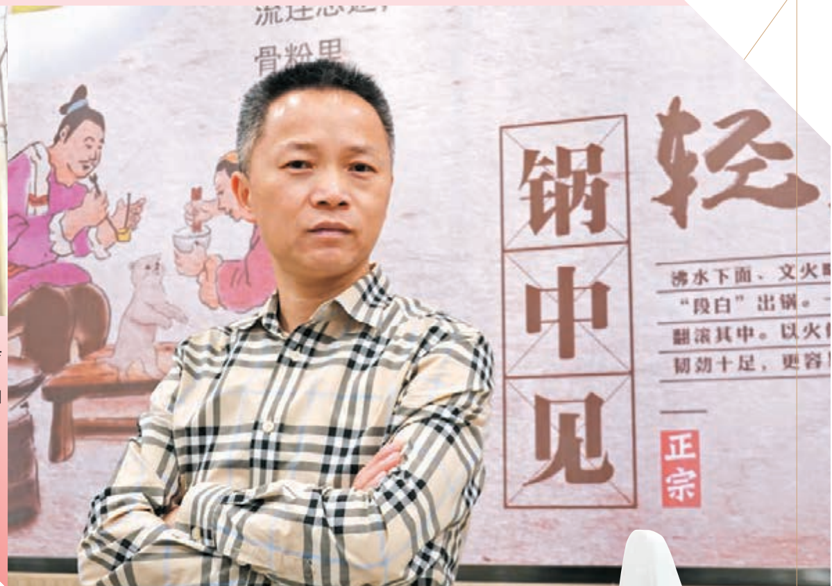
◆羅洪德是典型「吃得苦、霸得蠻」的湖南人個性。