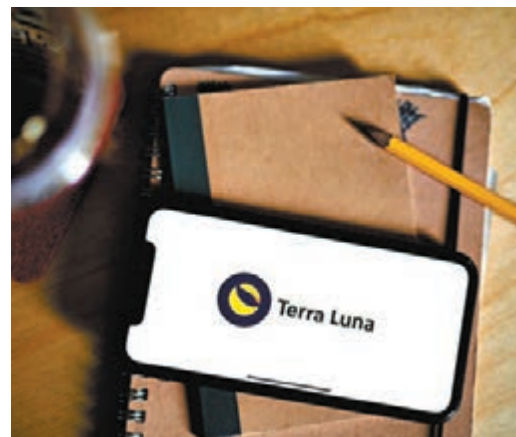
◆ LUNA幣由韓國人首創，最高峰時為近120美元，如今只有0.00013453美元，相當於一張廢紙。 資料圖片