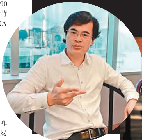
◆ 亞洲區塊鏈學會會長蔡志川稱，此次虛擬貨幣暴跌是由於沽空機構看準了機會大肆做空。