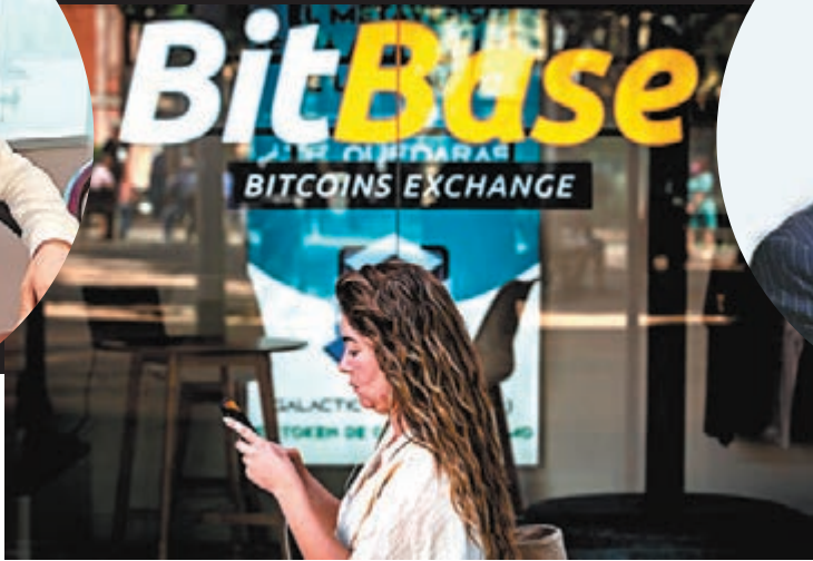
◆ 比特幣和以太幣為虛擬貨幣中的主流幣種。 資料圖片