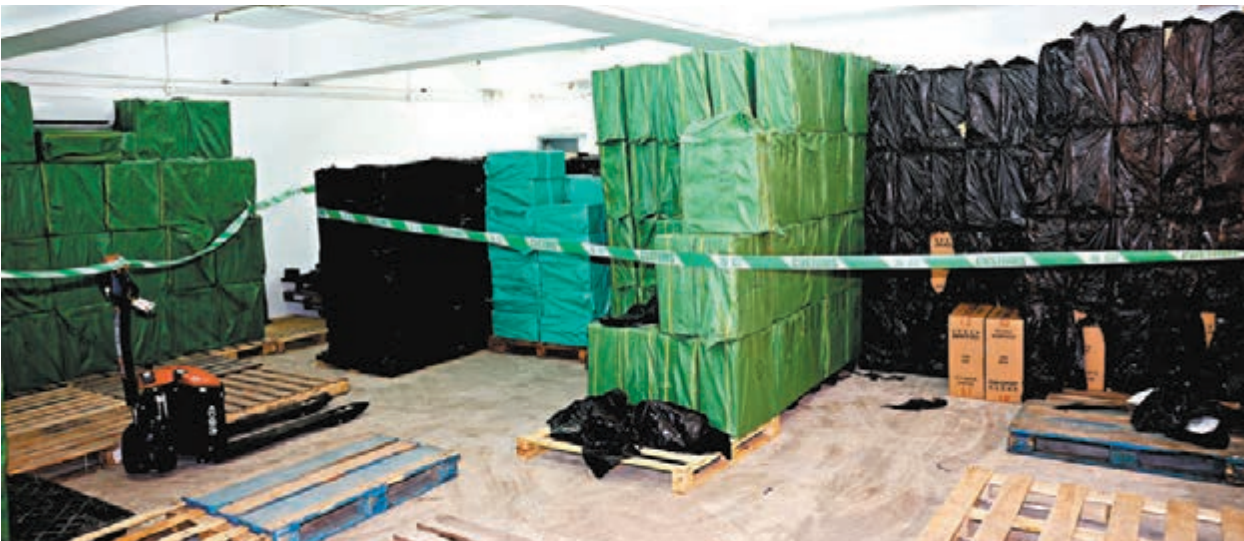
◆海關在柴灣新業街的工廈貨倉內檢獲700萬支私煙。

海關早前經全天候深入調查，鎖定一個活躍於港島區的私煙集團後，至前日晚上認為時機成熟，掩至柴灣新業街6號安力工業中心先在樓下卸貨區截停一輛正在卸貨的密斗貨車，當場檢獲100萬支私煙。隨後關員再登樓在