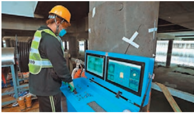
◆工作人員遙距操控機械人「深水清」進入河道，利用安裝在機械人上的閉路電視和聲納裝置尋找並吸取淤泥。網誌圖片

令」被發出定額罰款通知書。人員事後檢獲約280支酒精類飲品，總值約5.6萬元。警方提醒市民，派對房間雖已可重開，但管理人及顧客仍須遵守「限業令」下的相關限制，包括每個房間不得超過8人。任何人一經定罪，最高可被判罰款5萬元及監禁6個月。在疫情嚴峻時期，過往已有違反防疫規例人士被判處監禁，市民應顧己及人，嚴格遵守《預防及控制疾病條例》，以協助控制疫情及減低病毒在社區傳播的風險。另外警方強調，無牌賣酒屬嚴重罪行，一經定罪最高可判罰款100萬元及監禁兩年；而市民於無領取牌照的地方飲酒亦屬違法，一經定罪，最高可判罰款2,000元。市民切勿以身試法。