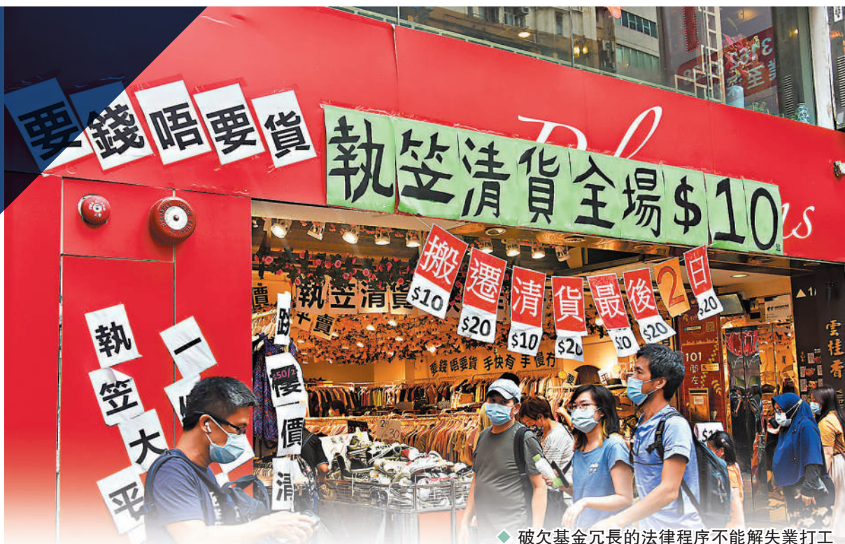
破欠基金冗長的法律程序不能解決失業打工仔的燃眉之急，勞工處擬自聘法律人員簡化申請程序。