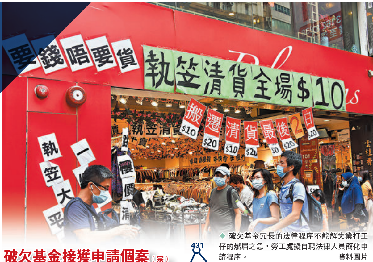
破欠基金接獲申請個案 (宗)

新冠肺炎疫情令香港餐飲、旅遊、零售等多個行業出現倒閉潮，部分手停口停的打工仔不但驟然失去收入，還被無良老闆欠薪，申請破產欠薪保障基金是他們最後一道「安全網」。然而，多個協助工友追薪的工會向香港文匯報反映，個別破欠基金申請需要兩年才領到錢，冗長的法律程序令不少人中途放棄，使基金運行的實際效果與成立初衷相悖。昨日勞工及福利局局長羅致光表示，特區政府正審視破欠基金申請程序，擬簡化由勞工處或基金直接聘請法律專業人員，減省申請法援的步驟，簡單個案可於三個月內處理好；政府亦計劃調整破欠基金特惠款項中的欠薪支付上限，由現時時的3.6萬元升至8萬元，料下月向立法會提交修例建議。有工會代表對有關改善表示歡迎。 ◆香港文匯報記者 文森