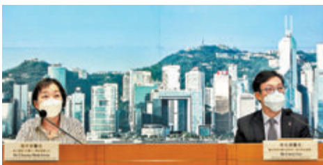
◆張竹君(左)表示，麥當勞分店不排除有更多個案。右為李立業醫生。

該名由美國抵港的六旬婦人完成酒店檢疫期後進入社區，曾惠顧太古城麥當勞餐廳，早前已令隔離的一家三口染疫。衛生防護中心傳染病處主任張竹君表示，該餐廳昨日再多兩名食客經強制檢測發現確診，他們分別是一名家住太古城陽閣的67歲男患者，以及一名住觀塘麗晶花園第六座的76歲女患者，其病毒CT值20多。該名76歲患者與六旬婦人不多時間光顧該間麥當勞，當時坐近MC Cafe的圓桌。傳染期曾到訪土瓜灣馬六甲 Malacca Cuisine、灣仔灣景中心大快活餐廳、怡和街麥當勞、旺角荷李活中心稻香、茶居食早餐，她兩名家人上周二亦已確診。衛生署正調查昨日新增的兩名染疫食客，以及早前確診的一家三口，是否帶有BA.2.12.1變異病毒。