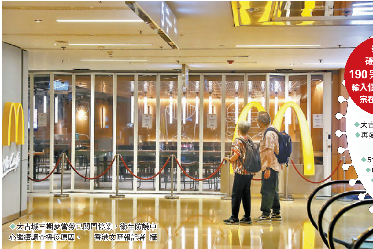
◆太古城三期麥當勞已關門停業，衛生防護中心繼續調查播疫原因。

他認為，關鍵不在於相關個案數目多少，而是會否令社區的重症增加，只要大部分市民已完成疫苗接種，就不會出現大量重症或死亡個案。