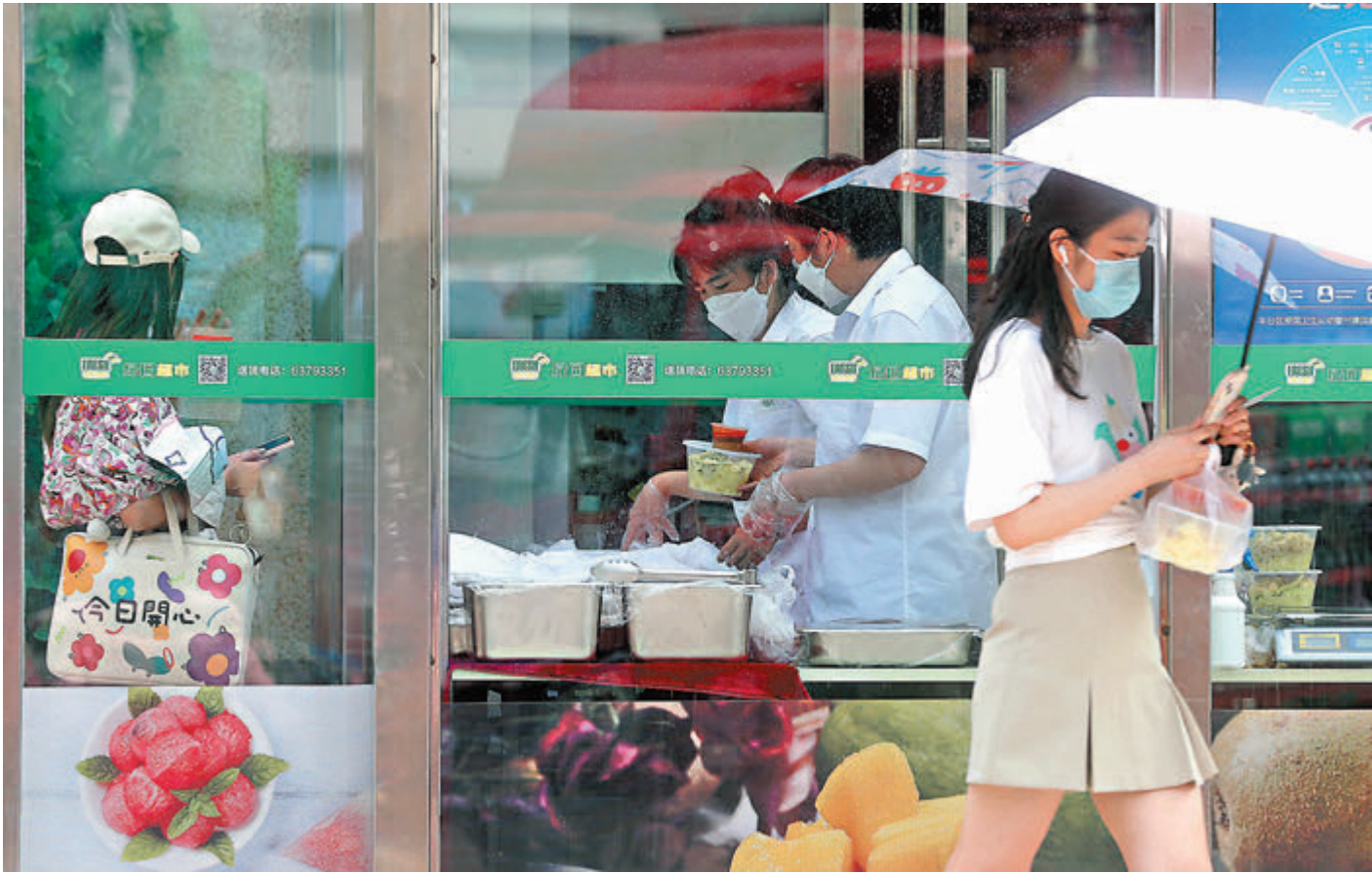
◆ 5月22日15時至23日15時北京市新增本土新冠肺炎病毒感染者63宗，豐台區23宗，佔約三分之一。圖為5月23日，北京豐台區居民在社區超市開設的便民窗口外購物。

雷正龍表示，近期，內地疫情整體呈現穩定下降態勢。近一周以來，內地每天新增本土感染者已經降至1,200宗以下，波及範圍進一步縮小。雷正龍指出，北京聚集性疫情和零星散發病例交織，局部地區和重點人群仍有感染傳播風險。四川廣安鄰水疫情處於波動下降期，疫情傳播風險較前期有所降低。天津、吉林近期有聚集性疫情發生，需加快檢測和風險點位排查。河南、安徽、江西、遼寧等地疫情已得到有效遏制，疫情形勢趨於平穩。