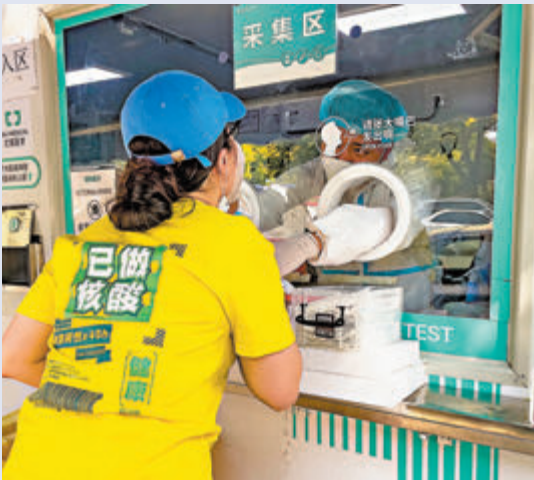
◆ 5月23日，市民在北京市朝陽區望京街道的一處常態化核酸檢測採樣點進行採樣。

郭燕紅強調，要進一步加大對核酸檢測機構的監督檢查力度，特別強調要依法執業，嚴格檢測質量。對於違法違規行為，要堅決進行嚴肅查處，並在全國進行通報。