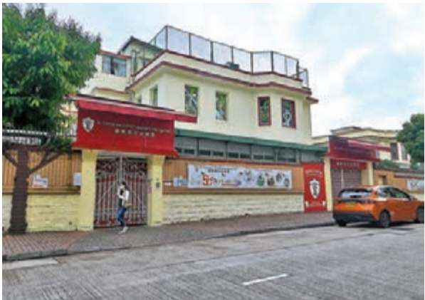
◆九龍塘國際英文幼稚園出現6宗陽性病例。 中新社 宗，是一個非常低的數字，但審慎起見，所以教育局早前已宣布學生和教職員每天進入校園前做快速抗原檢測的要求將延續至下月下旬，希望令學校更安心復課，校園亦更能免除病毒的感染。

4 名染疫學童最後上課均是上周五（20 日）。而昨晨再接到的兩宗呈報個案，其中一人是任教該班的老師，上周五出現輕微病徵，當日快測陰性，前日快測仍是陰性，因此照常返校任教，昨日全校接受核酸檢測，發現該名教師確診。另一人是上午班學童。確診教師打齊三針，而確診學童中僅有 1 人接種一針新冠疫苗。衛生署已派員到場採集環境樣本，該教室上下午班共 58 名學生需停課至本周五，該校其他班級沒有確診個案，歐家榮說：「不能排除這幾位同學在課室受感染，因為他們發病相距時間很近，亦沒有和其他社區的個案找到流行病學關連，似乎在課室出現小群組。很多同學沒有接種疫苗，所以為審慎起見，以防在這課室有進一步傳播，或再有個案出現，建議學校消毒班房，這些學生暫時要留在家中。」他提醒師生即使只是輕微症狀及快測陰性也不應上學，需要完成核酸檢測及沒有症狀，才可上學。行政長官林鄭月娥昨日在行政會議舉行前表示，復課逾一個月後，這每日快速抗原檢測找到的個案是 349