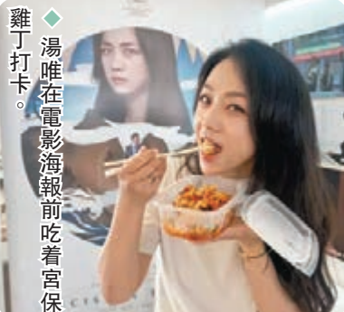
◆湯唯在電影海報前吃着宮保雞丁打卡。