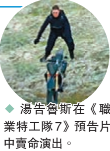
◆湯魯斯在《職業特工隊7》預告片中賣命演出。

最新的續作，也是系列的第7部作品《職業特工隊：死亡清算上集》(《職業特工隊7》)近日公開首個預告片，街頭飆車、沙漠騎馬、列車格鬥、懸崖飛車……見到阿湯哥上天下海施展渾身解數。另外，還有阿布扎比沙漠、聖彼得大教堂、威尼斯水城，世界美景盡收眼底。不過該電影卻因2020年爆發的新冠疫情，導致拍攝一波三折，上映不斷延期，現時要2023年才上映。