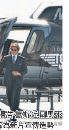
◆湯魯斯近日馬不停蹄為新片宣傳造勢。