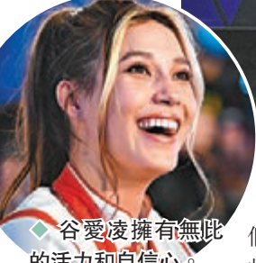
◆谷愛凌擁有無匹的活力和自信心。

谷愛凌努力有回報 另外，北京冬奧會冠軍谷愛凌亦上榜。《時代》雜誌的介紹詞寫上：「對於運動員，尤其是奧運會運動員來說，超越他們所選的運動項目的極限是困難的，但谷愛凌是一個例外。我不確定我見過比她更訓練有素、更有活力、更富決心的人了，努力終有回報。她證明了自己是有史以來最偉大的女性自由滑雪運動員之一，在網上積累了數百萬的追隨者，並激勵了新一代女孩——尤其是華裔和美籍華裔女孩——冒險進入男性主導的極限運動世界。她以優雅、鎮定和體貼的方式完