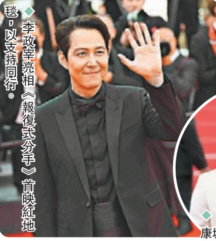
◆李政宰亮相《報復式分手》首映紅地毯，以支持同行。

香港文匯報訊 內地女星湯唯主演的韓國懸疑愛情電影《報復式分手》入圍今屆康城「主競賽單元」，角逐最高榮譽金棕櫚獎，有份爭影后的她日前已抵達當地，並於當地時間23日連同導演朴贊郁與男主角朴海日齊現身首映禮，而大熱韓劇《魷魚遊戲》男星李政宰也有現身支持。湯唯穿上米色低胸Deep V連身長裙，盡顯優雅氣質，不愧是「紅毯零失誤女神」。她又在電影海報前不經意晒出婚戒，讓婚變謠言不攻自破。