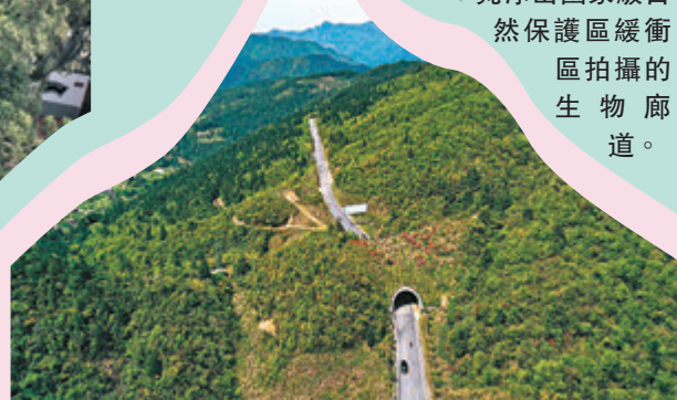
◆梵淨山國家級自然保護區緩衝區拍攝的生物廊道。