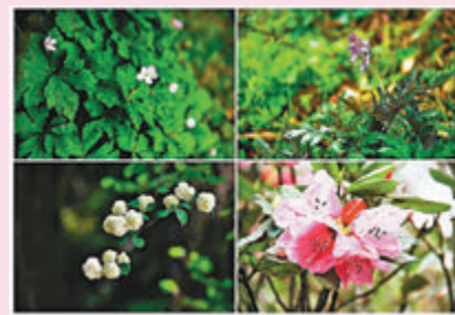
◆在梵淨山國家級自然保護區拍攝的野花。