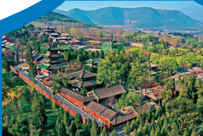
◆河南登封「天地之中」歷史建築群中的少林寺常住院

踏入五月初夏，萬物充滿生機，世界各地的自然文化環境盡入眼簾，當中被列入《世界遺產名錄》的河南登封「天地之中」歷史建築群、貴州梵淨山及杭州西湖文化景觀，在早前的拍攝中，天空之眼俯瞰這三個地方的美麗風貌，不愧是世界自然遺產及世界文化遺產中想探秘的地方。