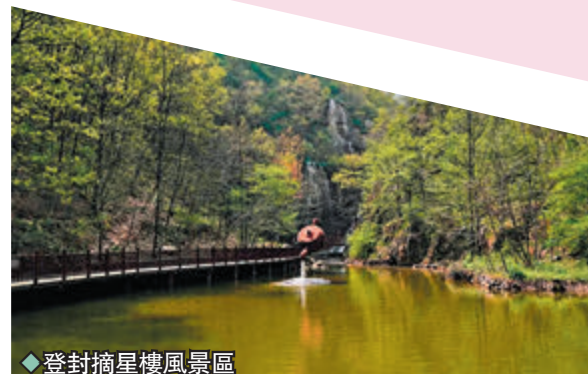
◆登封摘星樓風景區