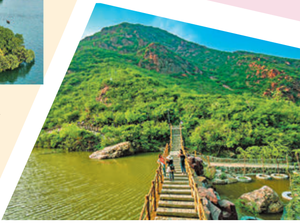
◆大熊山仙人谷景區