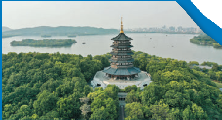
◆浙江杭州西湖景區雷峰塔