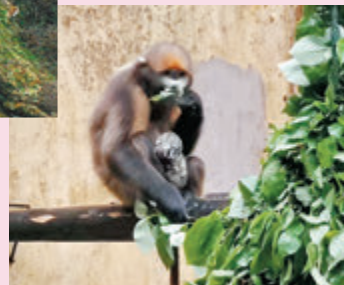
◆在梵淨山國家級自然保護區拍攝的黔金絲猴及幼崽。

梵淨山是西南一座具有2000多年歷史的文化名山，早在春秋戰國時期，梵淨山就屬楚國「黔中地」，秦朝屬「武陵郡」，漢代屬「武陵郡」，以後一直是「武陵蠻」崇拜的神山、聖山。梵淨山國家級自然保護區景點眾多，如紅雲金頂、黔靈山第一石、萬米睡佛、蘑菇石、老鷹岩及觀音瀑布等，其中最為矚目的是紅雲金頂，山峰拔地而起，垂直高差達百米，上半部分一分為二，由天橋連接，兩邊各建一廟，一邊供奉釋迦佛，一邊供奉彌勒佛，由此印證現代佛（釋迦牟尼）向未來佛（彌勒佛）的交替，晨間紅雲瑞氣常繞四周，人稱紅雲金頂。