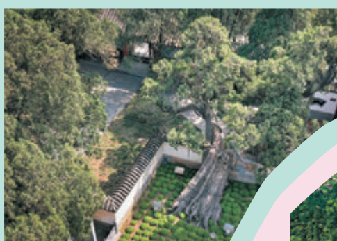
◆嵩陽書院內的「將軍柏」