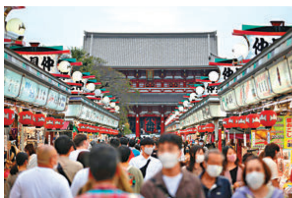
日本下月10日起將恢復旅行團入境。圖為東京淺草。

日本下月起將單日入境人數上限由一萬人增至兩萬人，下月10日起更恢復旅行團入境，每團人數上限7人，並按各地感染風險分藍、黃、紅三個組別。藍色屬低風險地區，旅客無論有否接種疫苗證明也可免檢疫入境，入境時亦無需檢測病毒；黃色為中風險地區，出示疫苗接種紀錄才無需檢測和檢疫；紅色屬高風險地區，入境須檢測及檢疫。