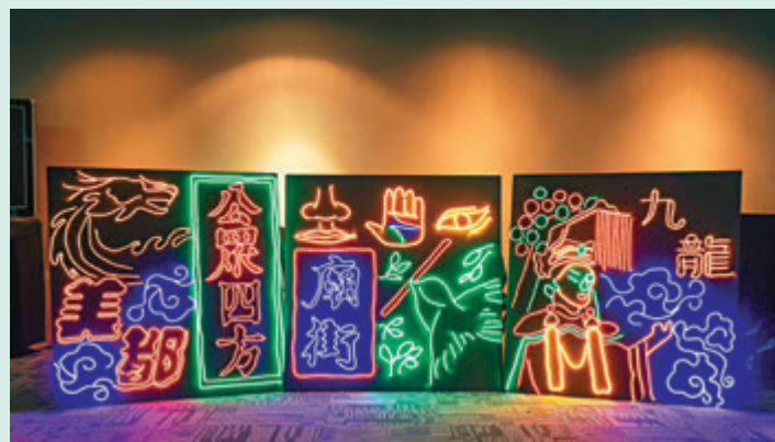
西九文化區藝術展下月將舉辦社區藝術展「西油記」，市民可前往欣賞及打卡。圖為展覽作品之一、具香港特色的霓虹燈招牌。