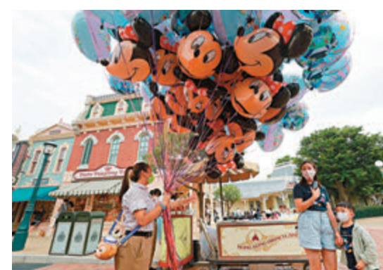
香港迪士尼樂園重開後對員工人手需求殷切。

他表示，招聘的全職初級員工，薪金加上津貼一個月有14,200元至18,000元，兼職職位的時薪則為