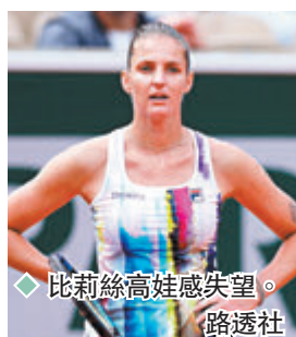
◆比莉絲高娃感失望。