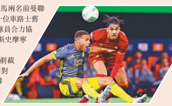
◆基斯史摩寧(右)攔截迪沙斯。

香港文匯報訊(記者 梁志達) 羅馬兩名前曼聯兵基斯史摩寧和米希達利恩，加上另一位車路士舊將譚美阿巴謙衝鋒陷陣，三位昔日英超球員合力協助球隊贏得今次錦標，當中以後防大將基斯史摩寧最可圈可點，當選為決賽的全場最佳球員。 史摩寧是役4次爭頂成功、4次解圍、2次刺截成功、1次埋門、傳球成功率89%、3次傳球到對方危險區域，助攻助守。這位32歲英格蘭前國腳以出色的表現，繼2016/17年的歐霸盃後再隨摩連奴贏下職業生涯第二個歐戰榮譽。