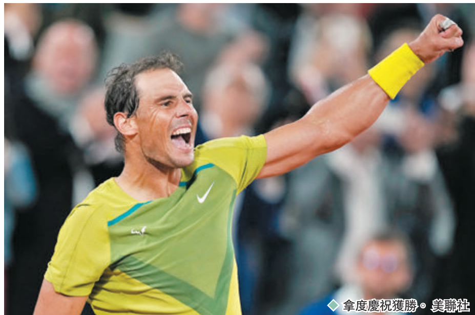
◆拿度慶祝獲勝。

綜合新華社報道 西班牙新銳艾卡拉斯堪稱本屆法國網球公開賽最受矚目的球星，這位剛在馬德里大師賽折桂的19歲小將被看作是「泥地王」拿度的接班人。但在當地時間25日的男單次圈比賽中，他卻一度被西班牙老將維諾拉斯逼入絕境，相比之下其西班牙前輩拿度當日晉級之路則輕鬆不少，收下他在大滿貫賽事的第300場勝利。