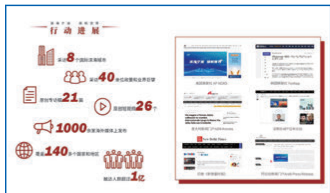
◆媒體人群觸達1億人次。

在釜山、佛羅倫薩、紐約、漢堡等地，「濱海寧波 揚帆世界」全球報道團隊更是通過多領域、多維度、多渠道報道，來傳遞寧波聲音，助力挖掘寧波與當地深入合作新機遇。一波接一波的報道，也引來當地媒體高度關注。比如，專訪韓國釜山市前副市長鄭鉉珉、釜山國際短片電影節理事長、運營委員長車敏哲的聯合報道在韓國、日本及亞太地區媒體投放後引起了Yonhap、Naver、The Korea Herald等超100+媒體的收錄刊發。而對話意大利佛羅倫薩5位各領域大咖後，包括ND Kronos、Informazione.it、Fortune Italia等意大利主流媒體紛紛跟進，繼而引來佛羅倫薩市長的關注，欣然接受報道團的採訪。