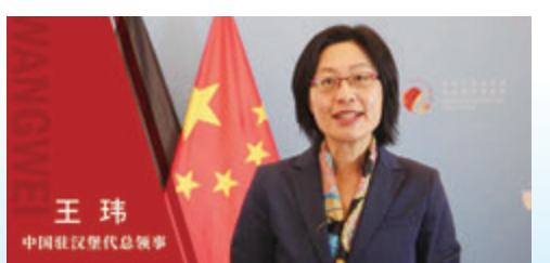
中國駐漢堡代總領事王瑋

中國駐漢堡代總領事王瑋稱，漢堡所在的北德地區一直是中德友好合作的領跑者，近年來積極參與「長三角與北德創新夥伴關係」的構建，寧波則是長三角一體化發展這一國家戰略中重要力量；而同為「一帶一路」重要樞紐，寧波舟山港、漢堡港之間的往來亦十分頻繁。「寧波和漢堡，兩港兩市強強聯手，有利於為世界經濟的復興、發展做更多貢獻。」