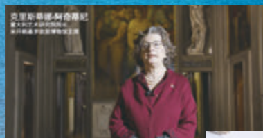
◆意大利藝術研究院院長、米開朗基羅故居博物館館長克里斯蒂娜·阿奇蒂尼。

「非常期待疫情結束後，希望拜訪寧波，帶著更多的項目來寧波，與寧波市政府共同推進多領域的合作，結出更多新碩果。這，對推進中意、中歐的合作有着深遠的意義！」佛羅倫薩市長達里奧·納德拉憧憬着他的新一次寧波之旅。