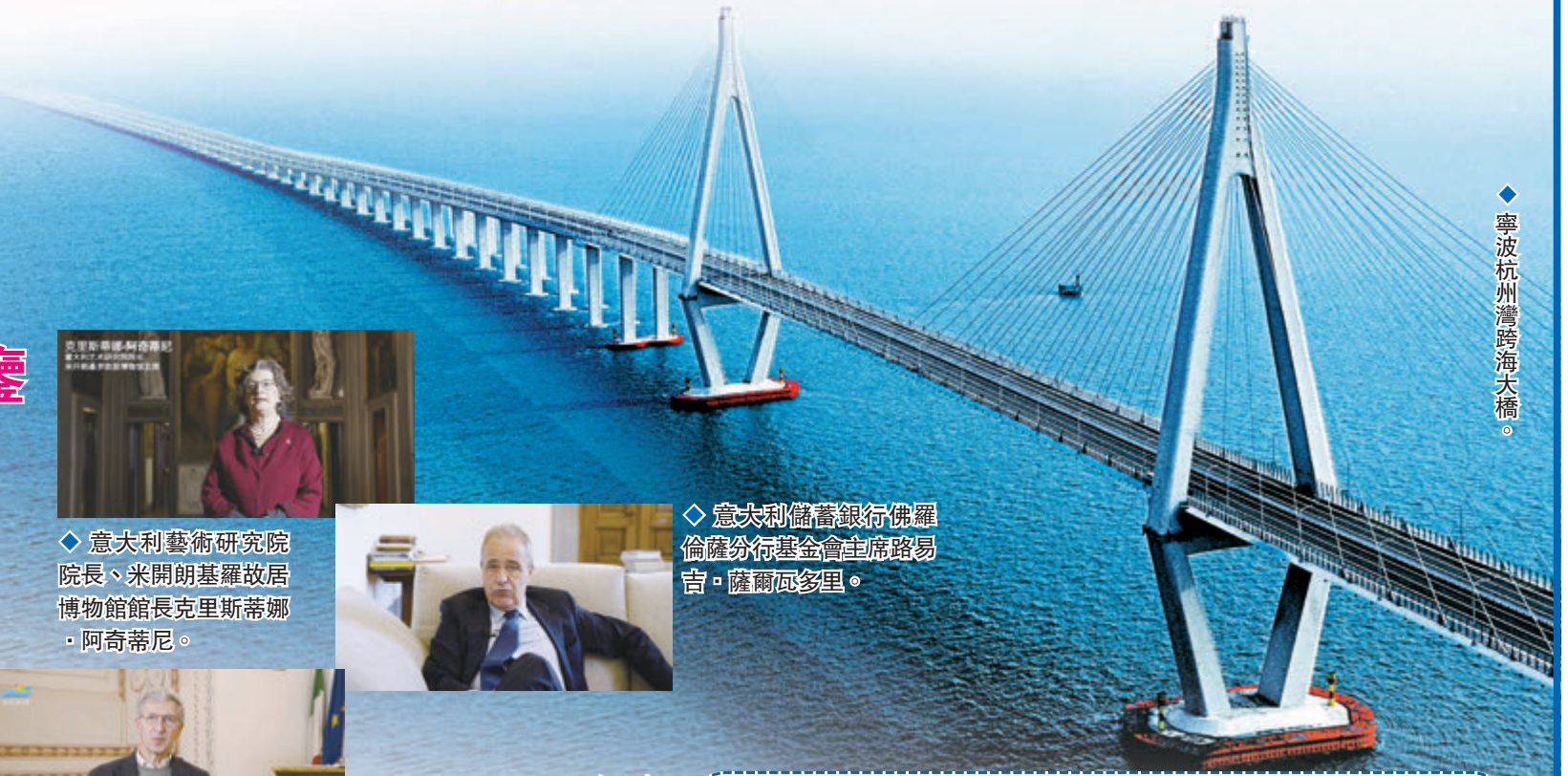
◆寧波杭州灣跨海大橋。

「一旦疫情形勢好轉，一定會來寧波拜訪，會會新老朋友！」拉斐爾·拿破侖說。這位意大利佛羅倫薩國際男裝展主辦方負責人與寧波結緣同樣始於寧波國際服裝節。在他看來，每座城市的時尚節，都是在深厚文化藝術積澱的基礎上求新。寧波打造時尚之都值得借鑒佛羅倫薩的經驗，讓全世界消費者都能感受到本土文化在發展中的獨特魅力。而佛羅倫薩也要向寧波，這座中國首個跨境電商零售進口破千億城市學習，在電子商務領域不斷創新。