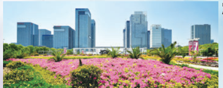
◆寧波積極發展國際金融中心。