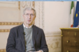
◆意大利托斯卡納大區博物館管理局局長斯特法諾·卡舒。