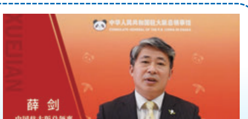
中國駐大阪總領事薛劍

中國駐大阪總領事薛劍，長期從事中國對日外交工作，亦對寧波十分了解。他認為，寧波既是濱海都市，又是東亞文都，與大阪有着很多類似的地方。大阪是西日本最大都市和經濟中心，以旅遊觀光、國際貿易聞名於世。其城市地位的塑造，是基於作為樞紐大港的悠久城市發展。而作為「一帶一路」樞紐城市、全球貿易重要參與者的寧波，在加快建設現代化濱海大都市建設中可以借鑒大阪經驗。