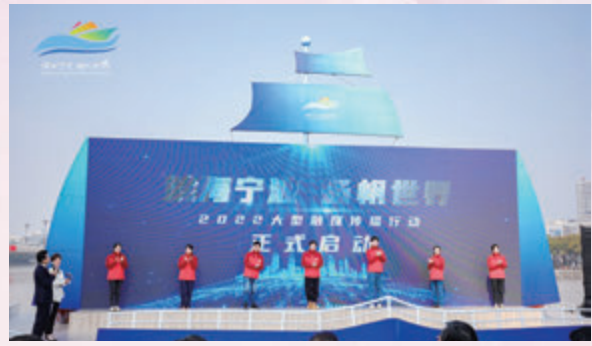
◆「濱海寧波 揚帆世界」啟動儀式。

傳播行動今年3月開始以來，融媒宣傳已覆蓋人群1億人次，海外已完成大阪、漢堡、迪拜、紐約、釜山、新加坡、佛羅倫薩、瓦爾納等8個國際城市的採訪，40餘位政要、業界巨擘接受了專訪，並對推動溝通合作表示出極大的熱情，紛紛表示將與寧波建立多方面交流合作，並推動更多文化交流文明互鑒。