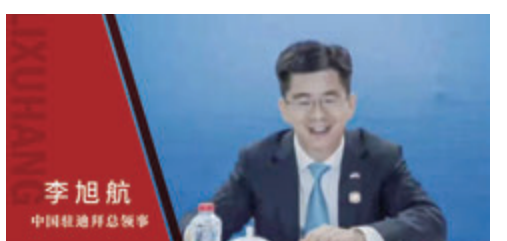
中國駐迪拜總領事李旭航

中國駐迪拜總領事李旭航在接受專訪時，特別提到寧波與迪拜的特殊情緣。2021年11月，迪拜世博會中國館舉行的「浙江周·寧波日」活動中，創造了成交額超1億美元的貿易訂單，拉開了寧波與阿聯酋地區在「一帶一路」未來建設中的合作序幕。這位曾在浙江任職的總領事介紹，迪拜是「浙江製造」在中東地區最大的貿易集散地。「如今，中國的很多貨物也是通過寧波舟山港出口到迪拜的傑貝阿里港，然後再出口到更廣泛的北非地區。『『迪拜經驗』，可以為寧波打造『六個之都』提供動力！」中國駐迪拜總領事李旭航為寧波建設現代化濱海大都市行動叫好，表示要輸出「迪拜經驗」，為寧波書寫海上傳奇出份力。