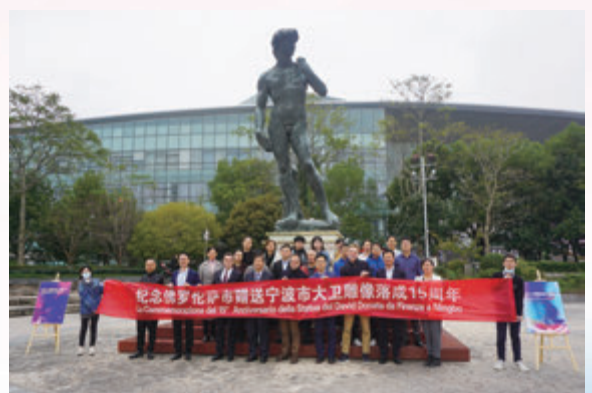
◆紀念意大利佛羅倫薩市贈送寧波市大衛雕像落成15周年合影。

互學互鑒、互利共贏。此次大型融媒傳播行動中，不少老朋友為寧波打call。韓國釜山市前副市長、2016年寧波市「茶花獎」獲得者鄭鉉珉，佛羅倫薩市政府議員、寧波市榮譽市民馬里奧·拉扎內里，佛羅倫薩皮提時裝展會公司總裁拉斐爾·拿破侖等寧波人民的老朋友，紛紛表示，將繼續做友好交流的使者，