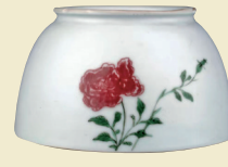
■ 康熙 綠彩釉裏紅花紋馬蹄尊