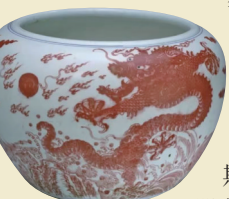
■ 康熙 釉裏紅雲龍紋鉢缸