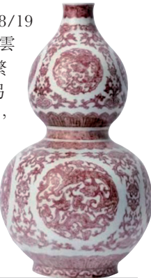
■ 乾隆 釉裏紅團花穿芝螭龍紋葫蘆尊

同場其他不容錯過的精品還有18/19世紀「御製紫檀嵌黑漆描金硬木雲龍紋寶座」，用料珍貴，構造繁複，堂皇華貴，彰顯皇權威嚴。另外還有「乾隆白玉高士圖筆筒」，以及重要藏家珍藏的30件匠心獨運的精美玉雕、琺瑯器及瓷器精品等。