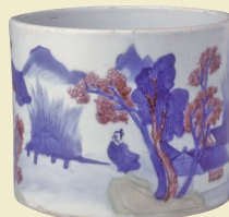
■ 康熙 釉下三彩山水圖筆筒