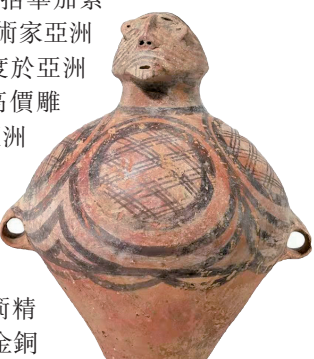
■ 馬家窯文化 馬廠類型彩陶人首罐

香港蘇富比乘春季大拍好業績之東風，5月25日再度為「萬古陶泥·中國新石器時代彩陶藝術」及「博古五千」舉槌。此兩場拍賣，當中包括各種中國藝術精品，有高古陶器、御製瓷器、玉器、漆器、料器、鑲金銅佛像等。尚有多組私人雅蓄，包括一組80年代得自日本的清代單色釉瓷器、亞洲私人收藏御窯瓷器及多個香港私人收藏瓷器精粹等，均同樣斬獲頗豐。