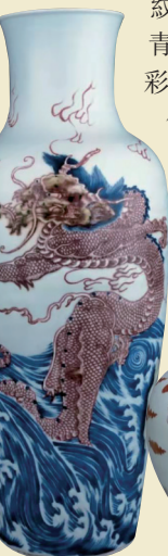
■ 康熙 釉下三彩波濤龍紋瓶

此外，加繪青花五彩的釉裏紅器頗有新意，在製作中，根據不同的造型，選擇相宜的繪畫色彩，配合十分巧妙。如有隻馬蹄尊，花卉在釉下用銅紅描繪，葉子莖幹則為釉上綠彩，細部為細微黑綠線。構圖簡潔，色彩飽滿，甚為少見。