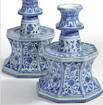
■ 明永樂 青花纏枝花卉八方燭台一對

此永樂青花八方燭台為明永樂官窯之驚絕珍品，是目前所知在私人收藏中唯一一對完整的傳世品。存世僅見四例同類永樂傳世品，分別收藏於北京故宮、廣東省博物館、日本出光美術館。