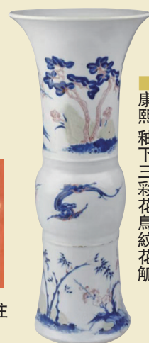
■ 康熙 釉下三彩花鳥紋花瓶