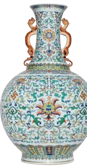
■ 乾隆 門彩萬福慶壽雙螭龍耳大瓶

首日揭幕的「卓越藏家非凡寶藏」旗開得勝，喜迎白手套佳績，近1.32億元總成交額，成為行方歷來價值最高的單一藏家名酒珍藏。5月23日，佳士得手袋及配飾現場拍賣錄得成交總額近5千260萬元。5月24日舉行兩項鐘錶專場，共錄得近3億元總成交額，寫下佳士得亞洲鐘錶部成交新高。