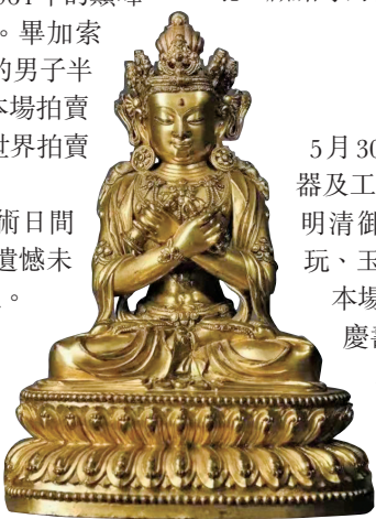
■ 明永樂 鑲金銅金剛總持坐像

張大千是香港書畫拍賣市場的重要標桿，佳士得「中國近現代及當代書畫」於5月29日舉槌，將呈現