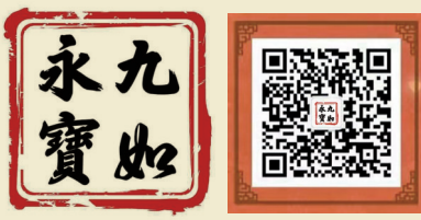
■ 九如永寶 長按識別，關注訂閱號 九如永寶訂閱號。

邦瀚斯香港5月29日舉辦「中國瓷器及工藝精品」專場。一對明永樂青花纏枝花卉八方燭台將驚艷全場。此燭台八方形，分為上、中、下三層，上層為燭插，中層為支柱，下層為台座，平底中空，燭插和台座均為束腰八方形，連柱圓柱形，形如酒盅倒扣。此燭台通體青花紋飾，柱插由上至下分別繪蕉葉紋、回紋、蓮瓣紋；連柱飾錐紋及纏枝蓮花紋一周。此燭台台座面飾海水紋以及連瓣紋一周，外壁八面繪八組各式纏枝花卉紋。足內飾白釉，白釉泛青，底心無釉。