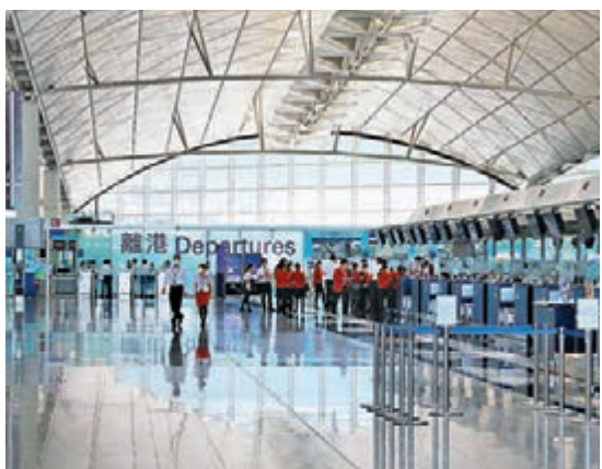
◆所有本月 24 日零時或以後抵港人士，須額外於抵港第九天進行強制核酸檢測。圖為香港國際機場。資料圖片

香港文匯報訊(記者 文森)一對美國返港夫婦早前在中環蘭桂坊酒店檢疫期間感染 Omicron BA.2.12.1 變種病毒後進入社區，結果引發太古城麥當勞、德思齊加拿大國際學校及灣仔不明源頭疫情，相關個案昨日已增至 27 宗。特區政府昨日宣布