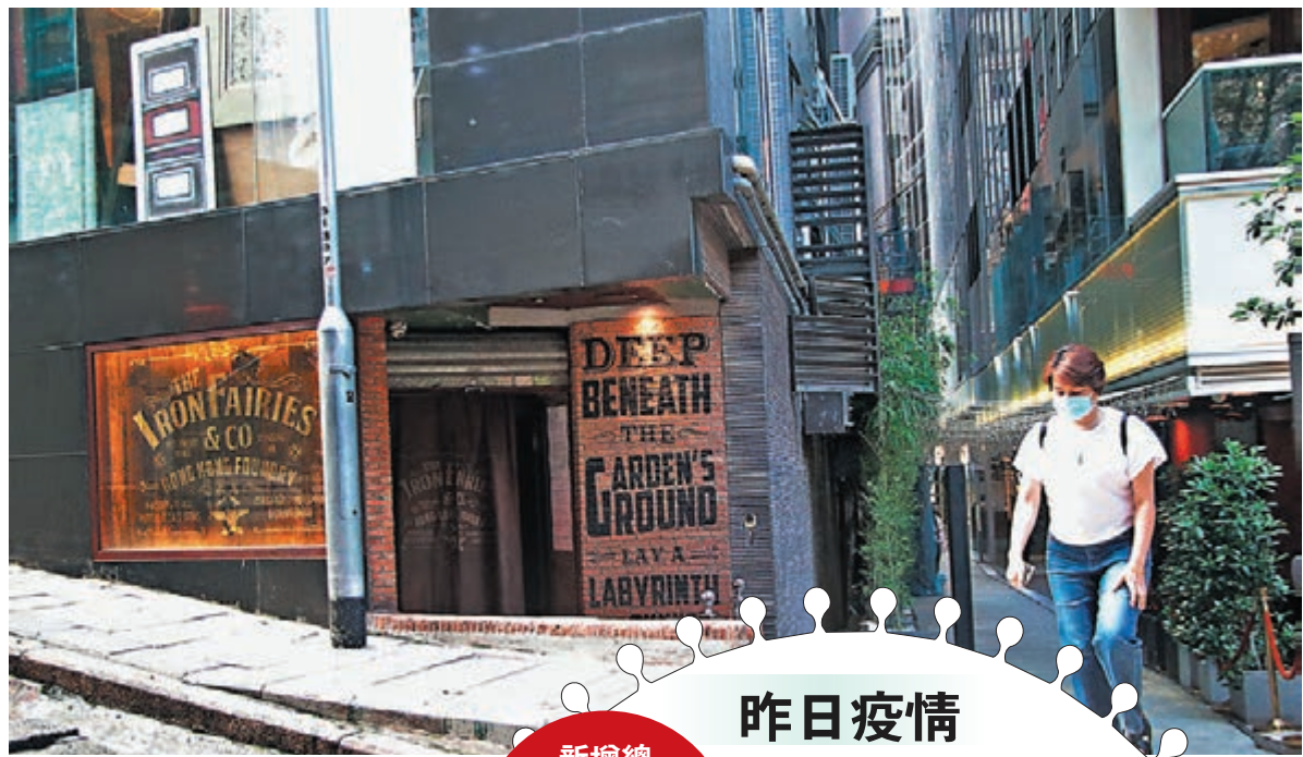
◆中環 Iron Fairies & J. Boroski 酒吧爆發疫情，11 名本月 21 日晚光顧的顧客檢測呈陽性。

另外，Zentral 酒吧群組 23 歲男顧客為元朗博愛醫院鄧佩瓊紀念中學兼職籃球教練，該校再有一名本月 24 日下午上籃球班的學生呈陽性，令染疫學生增至 7