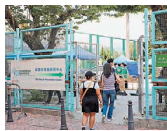
◆聶德權表示，留意到本月已有 60 萬人打第三針，呼籲市民盡快接種。圖為市民去社區疫苗接種中心接種疫苗。資料圖片

按第三階段「疫苗通行證」要求，一般市民若已完成接種兩劑疫苗逾半年，須在明日前提打第三針，未過半年則暫無須接種；至於確診者若康復未