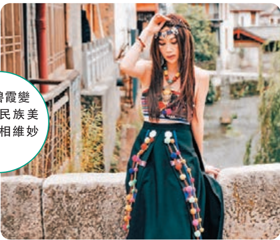
◆溫碧霞變身少數民族美人，扮相維妙維肖。