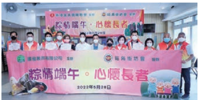
◆ 香港呂氏國際聯會傳遞「粽」情，向旺角街坊派發端午節福袋。

香港呂氏國際聯會日前舉辦「粽情端午，心懷長者」端午節敬老派福袋活動，於旺角街坊會地下長者中心向200名基層家庭派發端午節福袋。每份福袋包括2隻蒸粽、2個生果、1盒口罩及1盒連花清瘟，在慶祝端午佳節時，亦提醒居民要繼續對新冠肺炎疫情保持警惕。