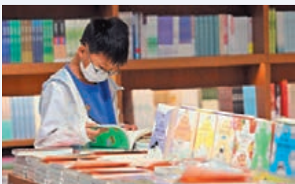
◆書讀多了，可以提高文學修養。