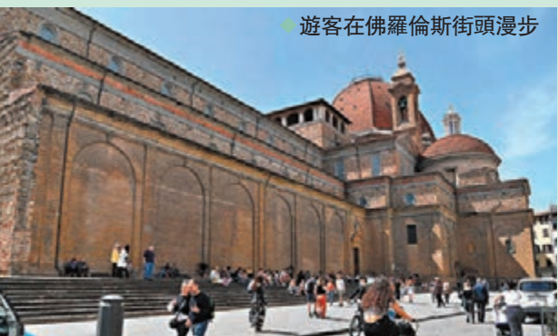
◆遊客在佛羅倫斯街頭漫步