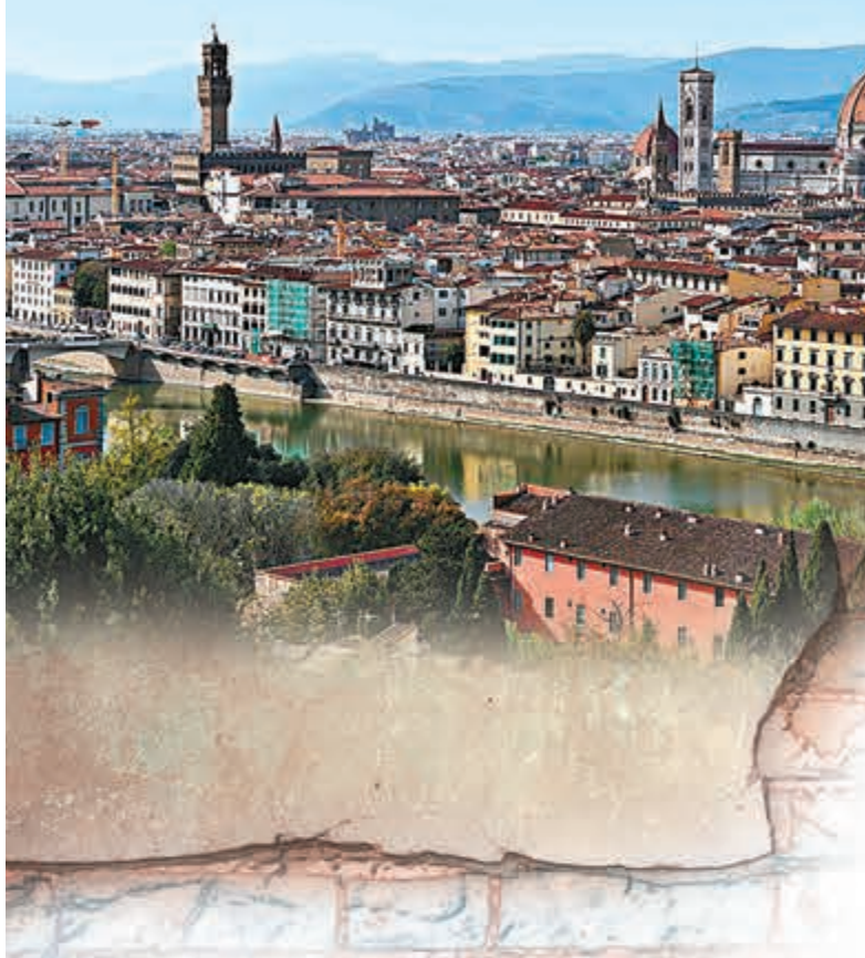
◆意大利佛羅倫斯城市風光