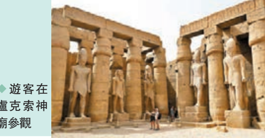
◆遊客在盧克索神廟參觀