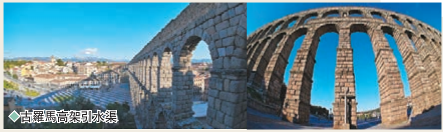
◆古羅馬高架引水渠

多米山崗上的塞哥維亞城堡，有居高臨下的氣勢；阿爾卡薩爾城堡則屹立在埃里斯馬河和克拉莫爾河交匯處的一個岬角上。除了教堂及城堡外，輸水道也是這裏最具象徵性的建築，其中羅馬大渡槽實際上是高架水道橋，是為了把18千米以外的水引到市區而建的，為此羅馬人開鑿了一條坡度很小的長水渠，修建了大渡槽。大渡槽全長728米，由120個花崗岩砌成的立柱支撐，兩柱之間圍成拱洞，渡槽離地面最高處29米。整個大渡槽用2萬多噸花崗石乾砌而成，由此顯現出羅馬人的建築水平。所以，這座令人驚嘆的雙拱建築鑲嵌在壯麗的古城之中，成為塞哥維亞驕傲的象徵。