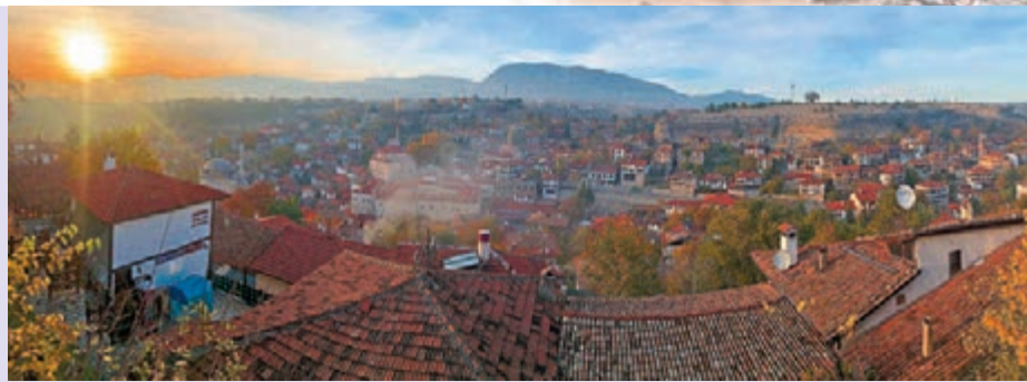
◆夕照下的土耳其番紅花城