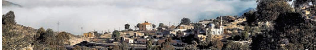
◆「雲中之城」阿斯馬拉美景