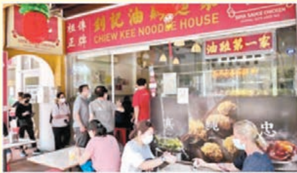
◆新加坡人為趕在最後機會食新鮮雞，不惜排長龍苦候。