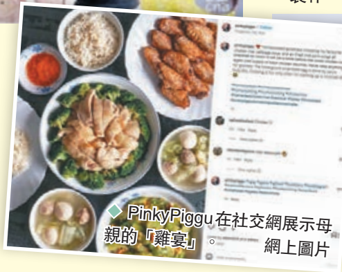
◆PinkyPiggu在社交網展示母親的「雞宴」。

然而並非所有餐館都在最後一刻迎來生意好轉，位於牛車水大廈的335港式燒臘女檔主受訪時表示，生意一直不怎麼好，還有食物沒有賣掉，