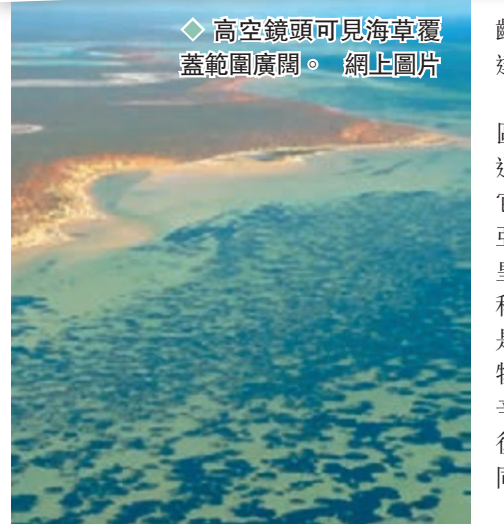
◆高空鏡頭可見海草覆蓋範圍廣闊。