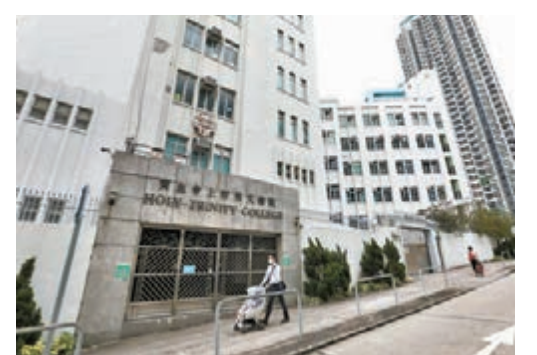
◆寶血會上智英文書院的爵士舞班一名跳舞導師及5名學生先後確診，另有6名跳舞學生需居家隔離。

施，新增4名學生呈報快測陽性，一名學生居於其中一幢宿舍，另外3名學生居於另一幢宿舍不同樓層，與他們同房的學生要隔離檢疫。張竹君指暫時仍屬零星個案，並無發現群體傳染，因此學校暫時無需停課。