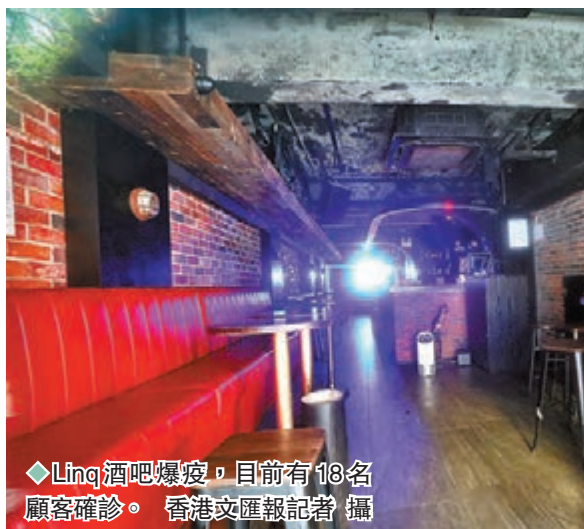
◆LinQ酒吧爆發，目前有18名顧客確診。

張竹君表示，BA.2.12.1仍然與香港流行的主流病毒株同屬BA.2系列。被問到今日端午節連同周末一連3天假期會否帶來疫情傳染風險時，張竹君指Omicron傳染力極強，只要在脫口罩的室內場所都很容易被感染，食肆酒吧的確有風險，但接種過完整疫苗的市民將有效防止重症。因此她呼籲市民若去公眾場所，切記打齊三針疫苗。