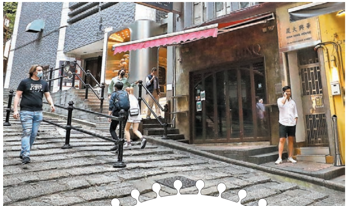
◆位於中環砵甸乍街35號的LINQ bar爆發。