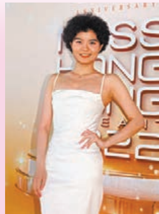
▲這爆炸頭髮型的佳麗相當搶鏡。