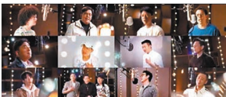
◆張學友、劉德華、譚詠麟、鍾鎮濤、李克勤等率領一眾男歌手合唱。

林曉峰也希望大家能一起來感受時代港星大合唱的氛圍感，一起來慶祝香港回歸祖國25周年！