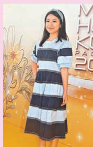
▲這位面試者年紀最小，只有17歲半。