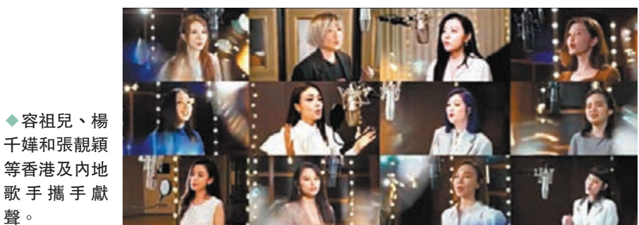
◆容祖兒、楊千嬅和張靚穎等香港及內地歌手攜手獻聲。