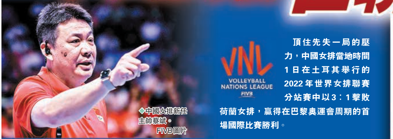
中國女排新任主帥蔡斌。