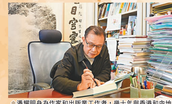
◆潘耀明身為作家和出版業工作者，幾十年與香港和內地文壇緊密聯結。