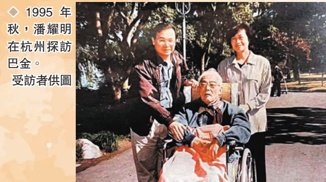
◆1995年秋，潘耀明在杭州探訪巴金。