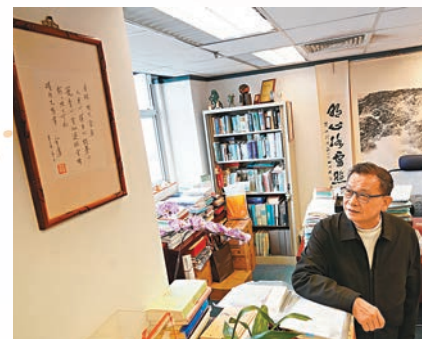
◆金庸是潘耀明的伯樂，2001年金庸寄贈他的硬筆字，一直掛在他的辦公室裏。