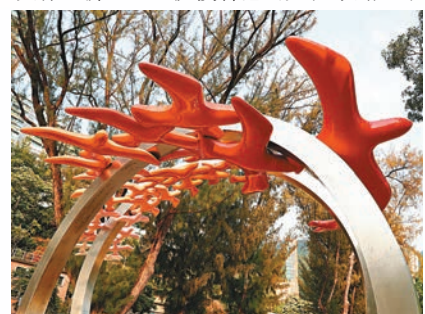
◆這座位於淺水灣的「飛鳥三十一」雕像是為紀念作家蕭紅而立。

潘耀明在2006年成立了「世界華文旅遊文學聯合會」，每兩年一屆邀請世界各地文學團體在香港等地舉行旅遊文化講座等活動。「考慮到嚴肅文學有時曲高和寡，旅遊是現代生活的一部分，我想透過旅遊引起關注，在香港推廣旅遊文學和華語文學。」這一活動也集結了內地、香港、台灣地區及海外的華文寫作者參加，包括名作家柏楊、余光中、余秋雨、王蒙、張曉風、尤金等等。