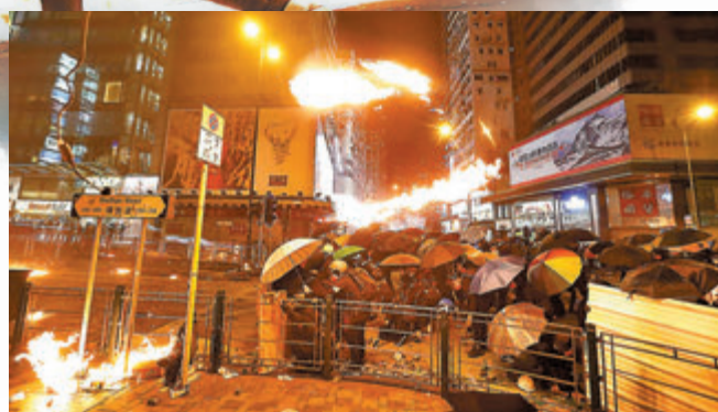
▲▼2019年11月18日晚黑暴在理大外圍「火攻」警方防線，下圖為防暴警冒着地面火勢驅散暴徒。