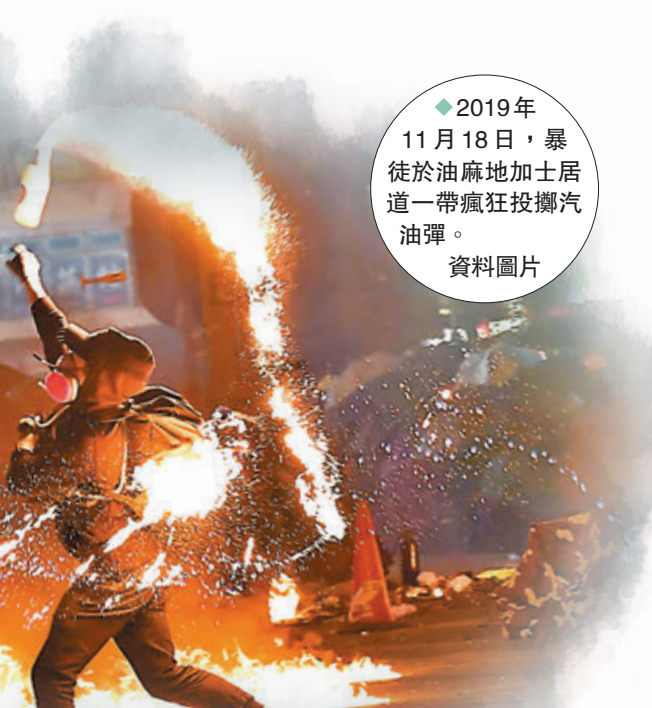
◆2019年11月18日，暴徒於油麻地加士居道一帶瘋狂投擲汽油彈。 資料圖片