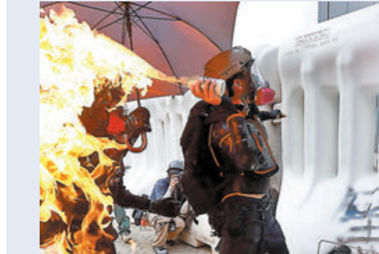
◆圖為2019年9月29日，暴徒將燃燒彈擲進總外的水馬之內。 資料圖片

香港文匯報訊（記者 葛婷）攪炒派於2019年9月29日煽惑非法集結，包圍政府總部投擲汽油彈及堵路演變成暴動，警方在驅散行動中拘捕96人控以暴動罪，分拆多案處理。其中11人包括7名學生的案件昨在區域法院開審。控方案情指，當日有暴徒在政府總部外佔據夏愨道車路及投擲汽油彈，各被告分別在夏愨道馬路或附近一帶被捕，根據各人被捕位置、時間和黑衣裝束、攜帶的防毒面具及「V煞」面具等，認為即使他們沒被拍攝到直接破壞社會安寧，但已有足夠證據令法庭肯定各人以示威者身份到場，且知道正值暴動並參與其中。