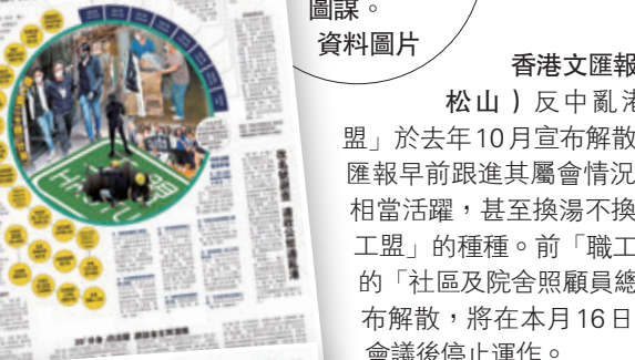
◆香港文匯報於今年4月多次揭露「職工盟」的圖謀。 資料圖片

香港文匯報訊（記者 藍松山）反中亂港組織「職工盟」於去年10月宣布解散，然而香港文匯報早前跟進其屬會情況，發現部分仍相當活躍，甚至換湯不換藥地延續「職工盟」的種種。前「職工盟」屬會之一的「社區及院舍照顧員總會」昨日宣布解散，將在本月16日最後理事會會議後停止運作。