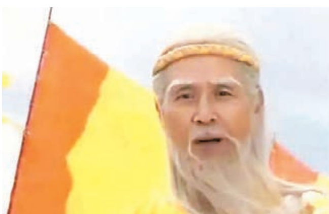
藍天野在電視劇《封神榜》中飾演姜子牙，慈眉善目、仙風道骨，形象令幾代觀眾難忘。