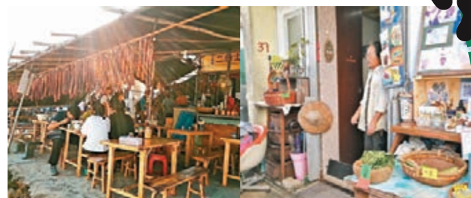
士多外掛滿了臘肉，充滿地道鄉村味。 村屋改造成店舖，內設工作坊。

由大埔墟火車站出發，乘巴士往烏蛟騰總站，烏蛟騰共有七條村落：新屋村、三家村、河背、老圍、田心、嶺背及新屋下。下車後，沿左邊烏蛟騰郊徑徑進發，上上落落，經亞媽笏及分水坳至荔枝窩風水林，沿途滿是樹蔭與溪流，非常舒服。在接近荔枝窩的時候，看到風水林指示牌，在尋覓風水林之時，我們偶然發現了荔枝窩自然步道。這條木板路很有趣，沿路的解說牌介紹了荔枝窩的生態和鄉村歷史。走過木板路後，奇形怪狀的樹木就在眼前，其中樹藤及空心樹最為著名，我們走近空心樹後一看，整棵樹幹的確通心的，蔚為奇觀。