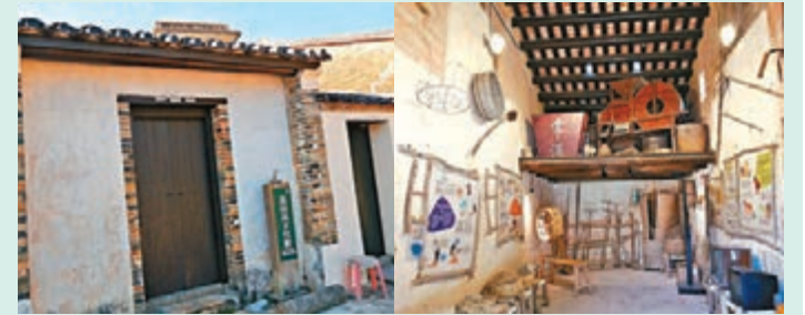
在荔枝窩文化館，遊客可體會慶春約的傳統客家文化。