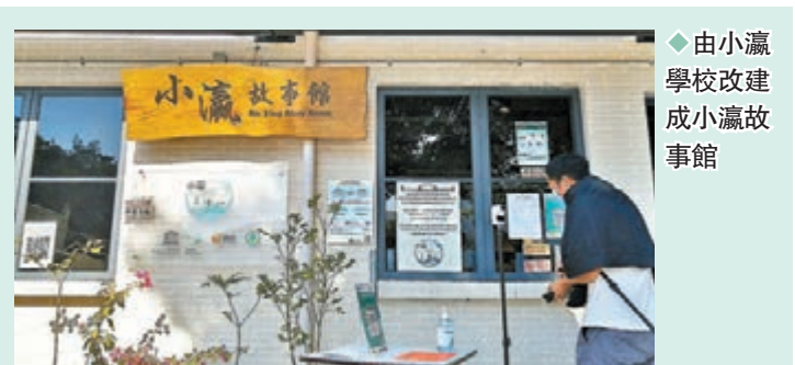
由小瀛學校改建成小瀛故事館

從荔枝窩離開，於下午3點30分搭乘渡輪返回馬料水，到達後，再搭乘272K號巴士或計程車至港鐵大學站，一天荔枝窩客家農村行完滿結束。