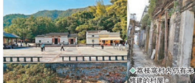
荔枝窩村內仍有未修建的村屋。