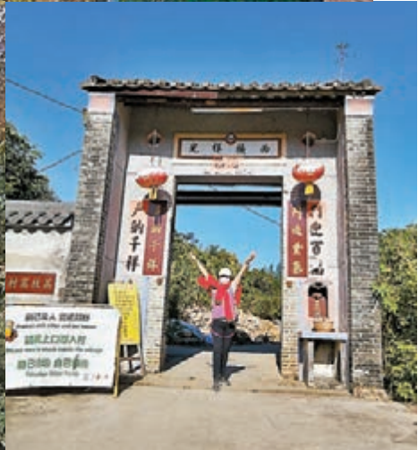
荔枝窩村尾，從這兒走進會看到花海。