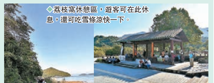
荔枝窩休憩區，遊客可在此休息，還可吃雪糕涼快一下。