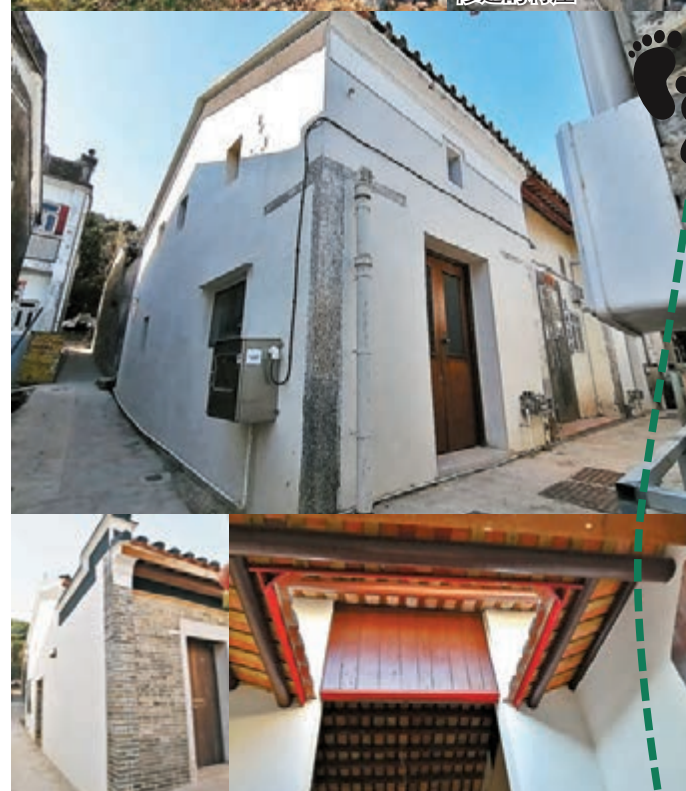
修葺好的村落，可作日後民宿之用。