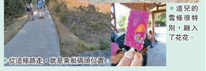
從這條路走，就是乘船碼頭位置。