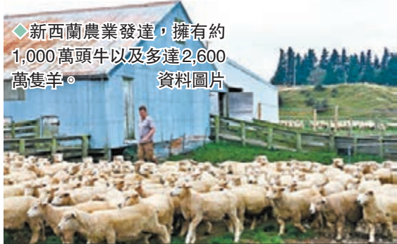
◆新西蘭農業發達，擁有約1,000萬頭牛以及多達2,600萬隻羊。資料圖片

新西蘭政府昨日公布一項全新環保方案，計劃對農業碳排放計價收費，首當其衝的，自然是當地最大排放來源、數千萬頭牛羊每天打嗝產生的溫室氣體。當局計劃自2025年起，向當地逾2萬個合資格農場徵收這筆「牛羊打嗝費」，詳細方案預計今年12月出爐，將成為全球首個要求農民為牲畜碳排放付費的國家。