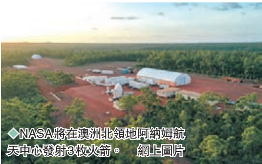
◆NASA將在澳洲北領地阿納姆航天中心發射3枚火箭。網上圖片

報道指，阿納姆航天中心具有很多競爭優勢，一方面因為它位處南半球，可以進入多個特殊軌道，另一方面是因為它非常接近赤道，地球自轉帶來的初速度快得多，可以大大節省火箭燃料成本。澳洲正希望憑着這種獨特優勢，在全球商用航天市場上分一杯羹。