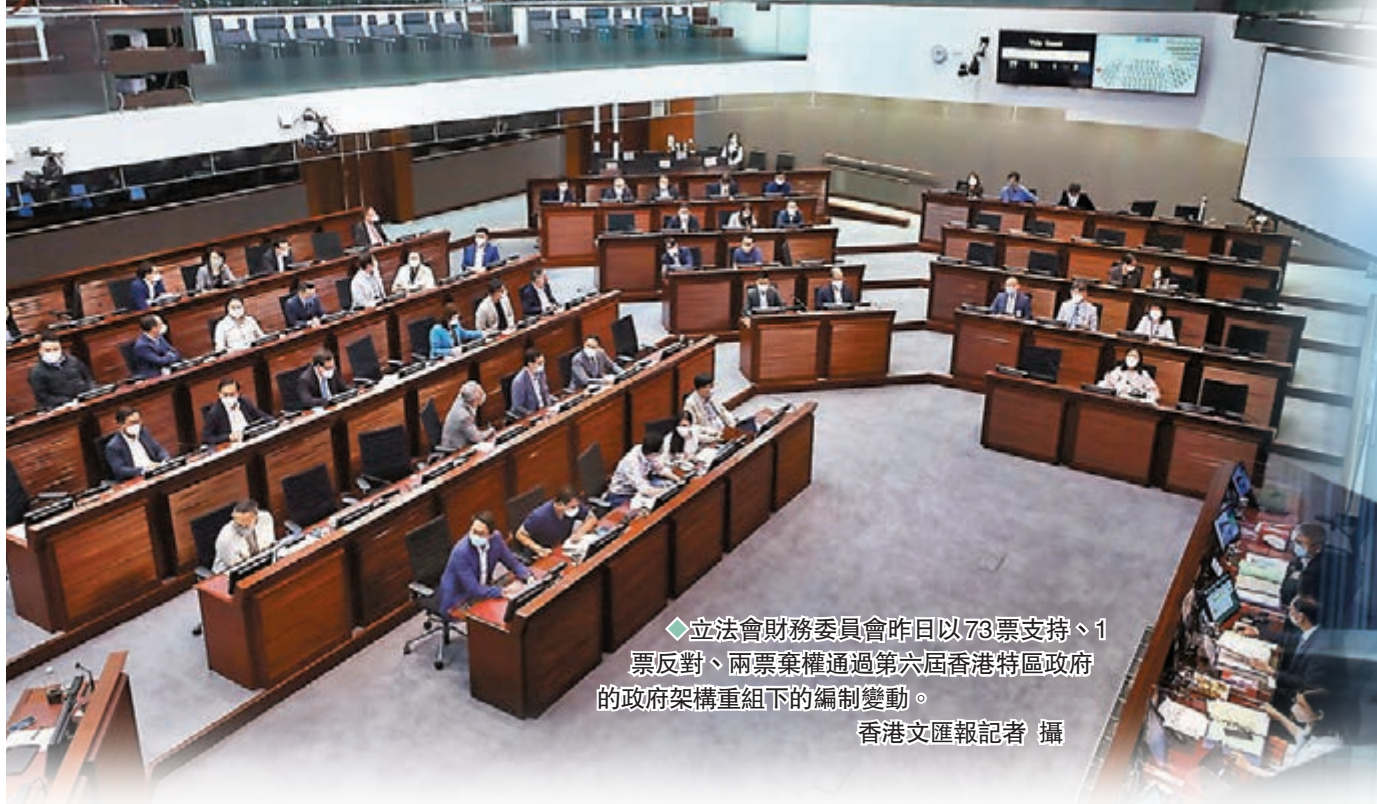
立法會財務委員會昨日以73票支持、1票反對、兩票棄權通過第六屆香港特區政府的政府架構重組下的編制變動。