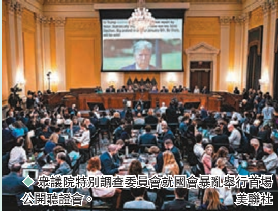
◆ 眾議院特別調查委員會就國會暴亂舉行首場公開聽證會。

隨着11月中期選舉臨近，國會暴亂聽證會如何影響選情，將成為各方關注焦點。美媒指出，聽證會於晚上8時至10時的黃金時段舉行，美國各大電視台都進行直播，民主黨希望更多美國民眾可以收看，讓暴亂事件再次回到公眾視野。 ◆綜合報道