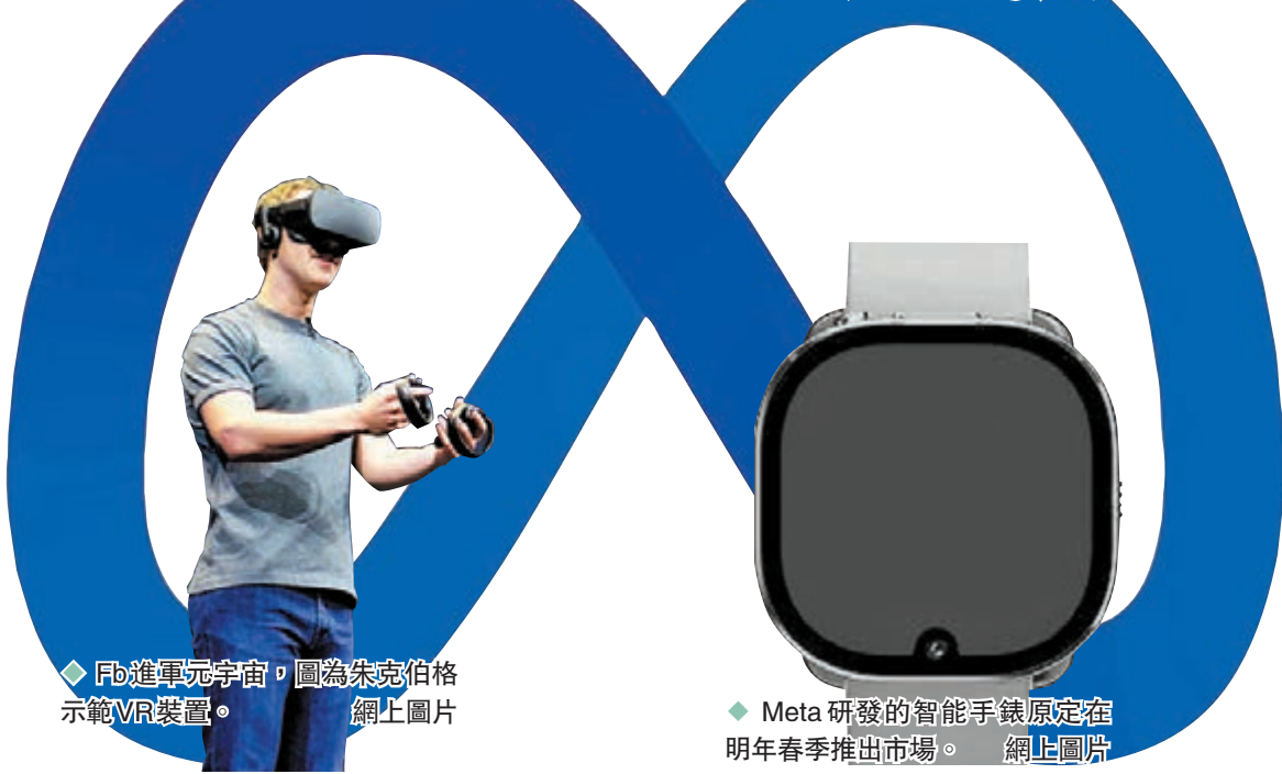
◆ Fb進軍元宇宙，圖為朱克伯格示範VR裝置。