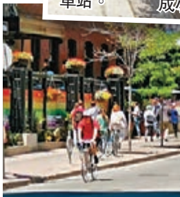
◆ 北美嚴冬過去，年輕人喜愛騎單車享受陽光。