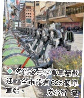
◆ 多倫多共享單車受歡迎，全市設有625個單車站。

加拿大近年沒有公布全國各地使用單車的統計數據，據悉卑詩省的溫哥華和維多利亞都是單車普及的地區。促進單車文化的慈善機構Cycle Toronto表示，多倫多在推動單車運動方面不及溫哥華和蒙特利爾，但多倫多的地勢較蒙特利爾平坦，而且天氣亦較和暖，適合踏單車。多倫多人喜歡騎單車的人數不少，既可減輕汽油負擔，亦可免除塞車之苦。多倫多市中心設有長年運作的單車共享系統，方便使用者隨時使用。