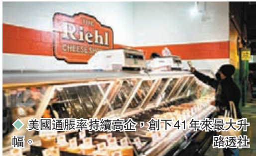
◆ 美國通脹率持續高企，創下41年來最大升幅。

美國勞工部昨日公布的最新數據顯示，美國5月份消費者價格指數（CPI）按年上升8.6%，不單高於市場預期的8.3%水平，更創下41年來最大升幅。消息拖累美股昨日早段急挫，三大指數均下跌逾2%，道瓊斯工業平均指數跌逾800點，截至香港時間今日凌晨零時，道指報31,469點，跌803點或2.49%，標準普爾500指數報3,903點，跌114點或2.85%，納斯達克指數報11,336點，跌417點或3.56%。