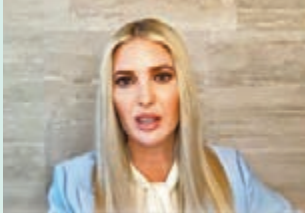
◀ 伊萬卡透過視頻作證，稱不認同大選「被偷竊」。