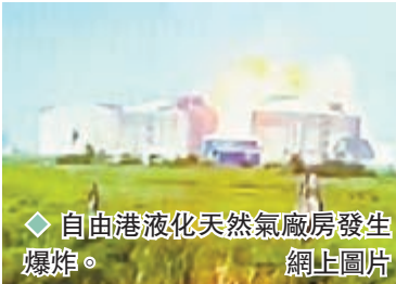
◆ 自由港液化天然氣廠房發生爆炸。

由於美國液化天然氣出口受阻，意味美國本地企業將獲得額外的天然氣供應，紓緩當地的供應緊張情況，美國7月份天然氣期貨價格因此一度下跌。然而美國部分地區持續受熱浪籠罩，導致用電需求大增，從而帶動天然氣需求上升，氣價其後重回漲勢。 ◆綜合報道