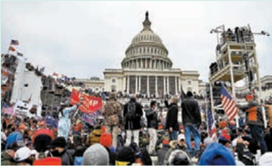
◆ 美國國會去年初發生暴亂，造成至少5人死亡。