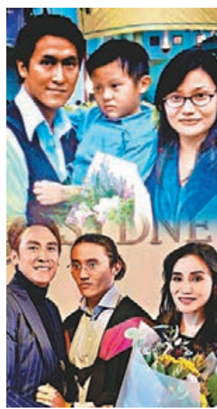
◆馬德鐘一家三口特別擺出與舊照一樣姿勢的合照。