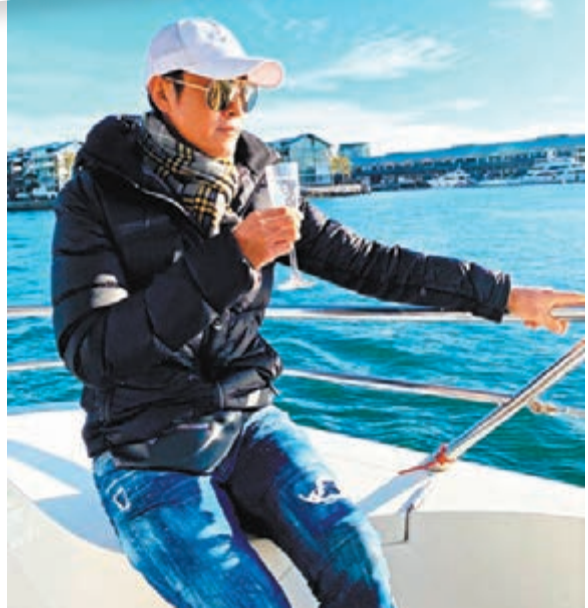
▶馬德鐘坐在遊艇上嘆世界。