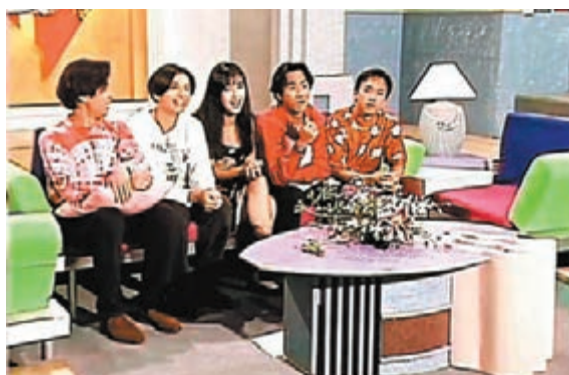
◆周慧敏曾接受 Beyond 訪問。

慘食檸檬。 Vivian 留言：「在這個特別的日子，有感動分享一條特別的影片。1991年夏季，少有曬得黝黑的我，很榮幸被 Beyond 樂隊邀請當他們節目的嘉賓。在之前，每次合作都是我擔當電視或電台節目主持人訪問他們，這次調換了角色替我們和觀眾都帶來了新鮮感。那是個開心的暑假。忽爾今夏，仍然在為我們的 Beyond 樂隊感到驕傲，仍然在懷念我們的音樂奇才黃家駒先生……」