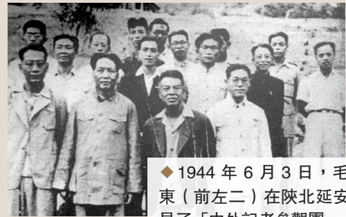
◆1944年6月3日，毛澤東（前左二）在陝北延安會見了「中外記者參觀團」。