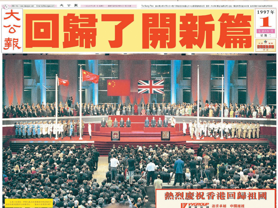
熱烈慶祝香港回歸祖國

中國恢復對香港行使主權，香港從此結束一百多年的英國殖民管治，回歸祖國懷抱，成立香港特別行政區，實行「一國兩制」「港人治港」、高度自治。《大公報》當日的封面連同封底以別出心裁的設計，報道了這一劃時代的事件。