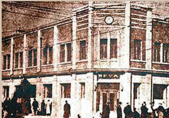
◆昔日天津租界的《大公報》館址。