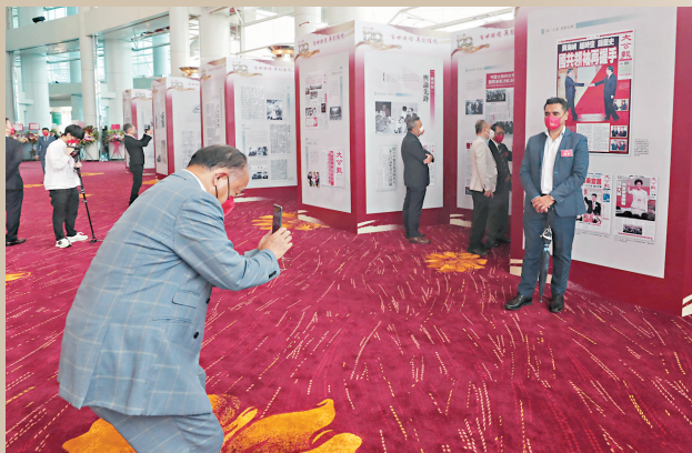
◆觀眾紛紛在圖片展拍照留念。

上世紀八九十年代，《大公報》為香港的平穩過渡、順利回歸發揮了輿論先導作用；香港回歸後，《大公報》立足香港，背靠祖國，面向世界，及時傳遞中央聲音，團結凝聚香港社會各界，支持特區政府依法施政，忠實記錄和推動「一國兩制」成功實踐，為香港的繁榮穩定作出了積極貢獻；進入新時代，尤其是香港大公文匯傳媒集團成立之後，《大公報》加快融合發展步伐，實現了全媒體跨越式發展，傳播力影響力不斷增強，在支持香港撥亂反正，推動香港融入國家發展大局，促進人心回歸過程中，發揮了愛國愛港傳媒旗艦的作用。