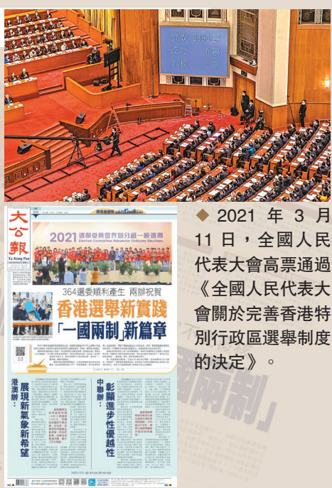
◆2021年3月11日，全國人民代表大會高票通過《全國人民代表大會關於完善香港特別行政區選舉制度的決定》。

2021年3月11日，全國人大通過關於完善香港特別行政區選舉制度的決定，開啓香港民主發展新篇章。完善香港特別行政區選舉制度，必須全面準確貫徹落實「一國兩制」、「港人治港」、高度自治的方針，維護憲法和香港基本法確定的香港特別行政區憲制秩序，確保以愛國者為主體的「港人治港」，切實提高香港特別行政區治理效能，保障香港特別行政區永久性居民的選舉權和被選舉權。