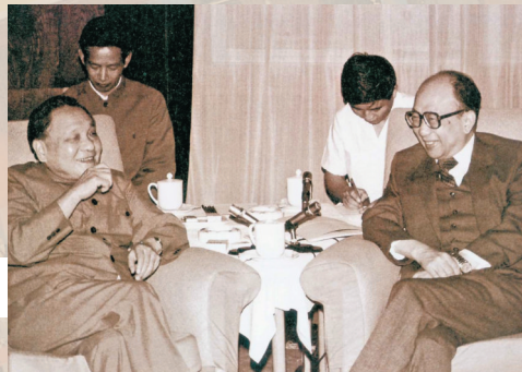
◆1982年，鄧小平在北京會見《大公報》社長費彝民等12人，宣布中國將收回香港。

1949年10月1日，中華人民共和國宣告成立，《大公報》次日以頭條作了報道，香港版頭條是新政府向國際發出的願意建立正常平等關係的消息，並配以總理周恩來的照片。