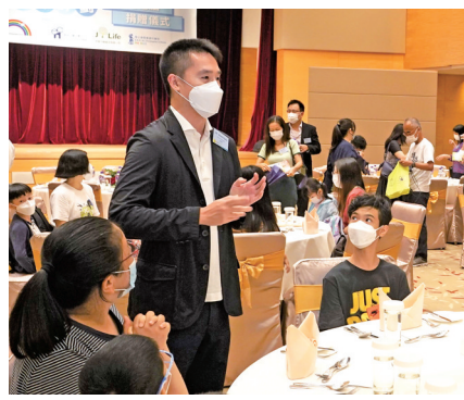
◆郭基輝向基層家庭表達關懷。

在捐贈儀式後，新鴻基地產執行董事郭基輝更連同澳洲會計師公會的來賓，參觀挪亞方舟各式活動教育設施，包括「飛凡小機師訓練營」、全新的「挪亞有機農莊」及「馬灣活動中心」等，以計劃於不久將來合作推出更多回饋社會的項目。而一眾受惠學童則免費參觀挪亞方舟各式景點及享用自助午餐，體驗富有意義的旅程。