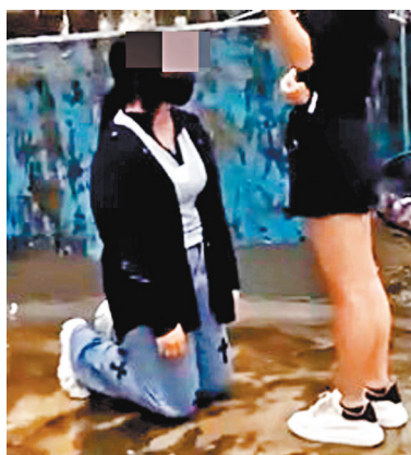
◆少女跪地被掌擱欺凌。網上截圖

其間，有穿背心少女更挑釁跪地女子，「打我呀嘛!」、「妳不，我打你囉」，隨即出手向她狠擱數巴，接着另一名穿短褲少女又上前接力再出手連環掌擱，旁邊則有人說「不夠爽」；此外，有人說「係咪寸啊!」、「我知你好唔『GUR』(順氣)!」，跪地少女在對方脅迫下不敢出聲。片中可見，跪地少女前後被掌擱逾21巴，臉頰被打至紅腫。另一段影片則長約3秒，只見穿背心少女向跪地少女連擱3巴，相信是另一人在不同角度拍攝。 影片在網上流傳後引起網民熱議，當中不少人質疑事件發生地並非香港，但有人則解說有人提及「仲敢返嚟香港」，估計應在香港發生。有網民直斥事件「恐怖」、「夠線」；不過有網民指拍片人很笨，「自己拍片留證據人拉。」