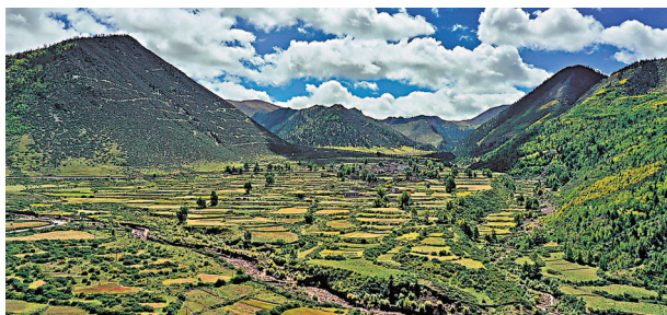
◆由川西芒康入西藏，一路風光絕美。