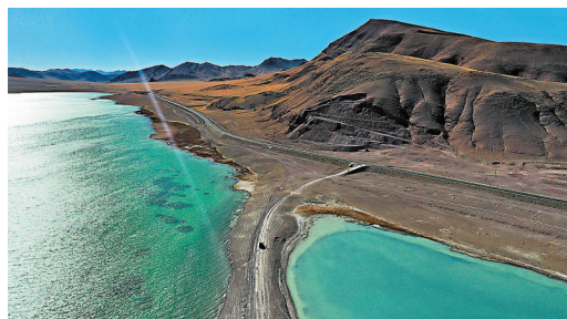
◆317國道途經阿里地區改則縣時的兩個湖。