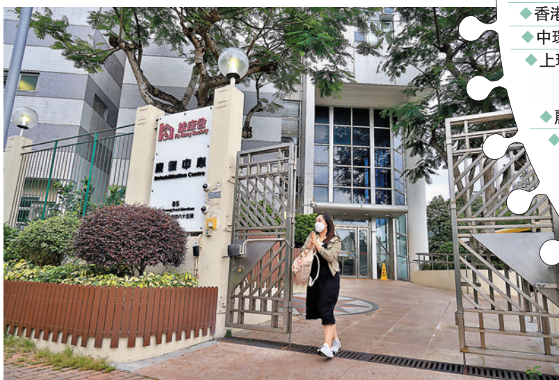
◆香港仔殘疾院舍漁光道扶康會悅群之家新增5宗個案，相信感染源頭來自社區。圖為香港仔扶康會康復中心。